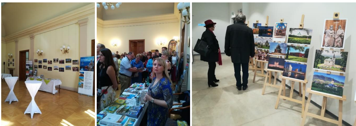
Výstavka fotografií Martina Peterky se přesunula z českého velvyslanectví v Budapešti na Slovenské hradiště v Mikulčicích.