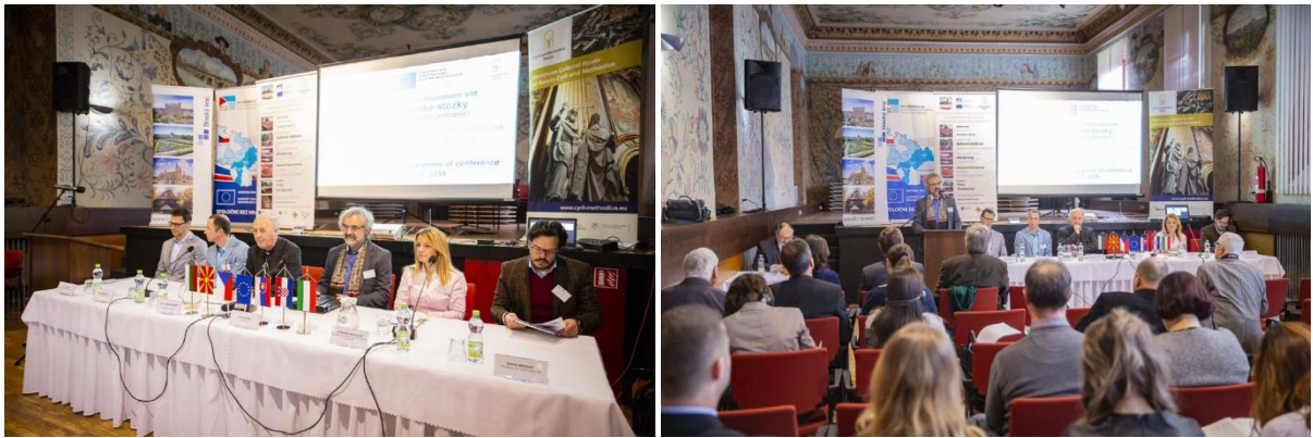
Zahájení konference na Velehradě za účasti představitelů Ministerstva zemědělství a rozvoje venkova Slovenské republiky, Ministerstva pro místní rozvoj České republiky, Arcibiskupství olomouckého, obce Velehrad a Stojanova gymnázia Velehrad.