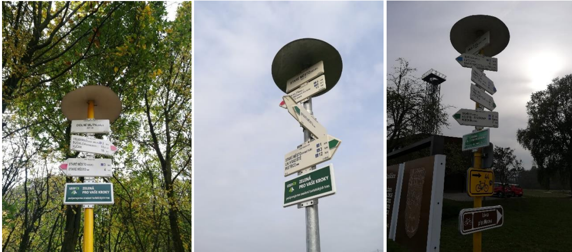
Modré piktogramy přibily také na trase mezi Starým Městem a Velehradem nebo u Slovanského hradiště v Mikulčicích.