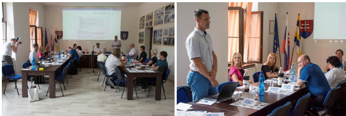
Valná hromada jednala v Močenku.

V Močenku, jedné z členských obcí, se konalo 20.6.2019 výroční jednání Valné hromady sdružení. Bylo zrekapitulováno a schváleno vyrovnané hospodaření sdružení za rok 2018 a související výroční zpráva, podány informace o projekty v realizaci a přípravě, a jejich financování, přijati noví slovenští členové – obec Terchová a Slovenský dom Centrope, sdružení právnických osob sídlící v Bratislavě. Také byl schválen statut pozorovatele u obce Zalavár (Maďarsko) a Centra pro studium v kulturním rozvoji v Bělehradě (Srbsko). Valné hromadě předcházelo přípravné jednání Řídicího výboru, které se konalo 2.7.2019 ve Zlíně. Jednání se účastnila také zástupkyně Bulharského kulturního institutu v Bratislavě, navrhla zorganizovat studijní cestu do Bulharska ve spolupráci se Slovenským domem Centrope.