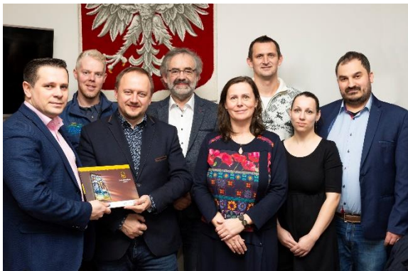
Jednání se starosty Jablunkova a Wisly.

Navazující jednání se má konat ve Wisle 27. 4. 2020, přizváni jsou i zástupci krajského úřadu v Katovicích nebo Ostravsko-opavské diecéze. Zda se uskuteční, bude záležet na vývoji situace.