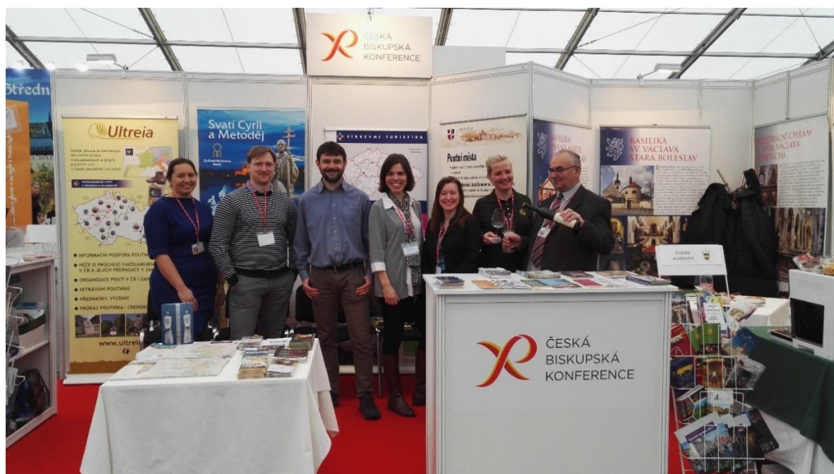
Cyrlometodějská stezka součástí stánku ČBK na Holiday World Praha 2019.

Začátek roku přinesl prezentace na mezinárodních veletrzích cestovního ruchu . Cyrlometodějskou stezku jsme prezentovali na veletrzích v Brně na Regiontour 17. – 20.1. (stánek Centrály cestovního ruchu Východní Moravy), na ITF Slovakiaitour v Bratislavě 24. – 27.1. (stánek Centrály cestovního ruchu Východní Moravy) a na Holiday World v Praze 21. – 24.2. (stánek České biskupské konference v sekci Památky – muzea – řemesla).