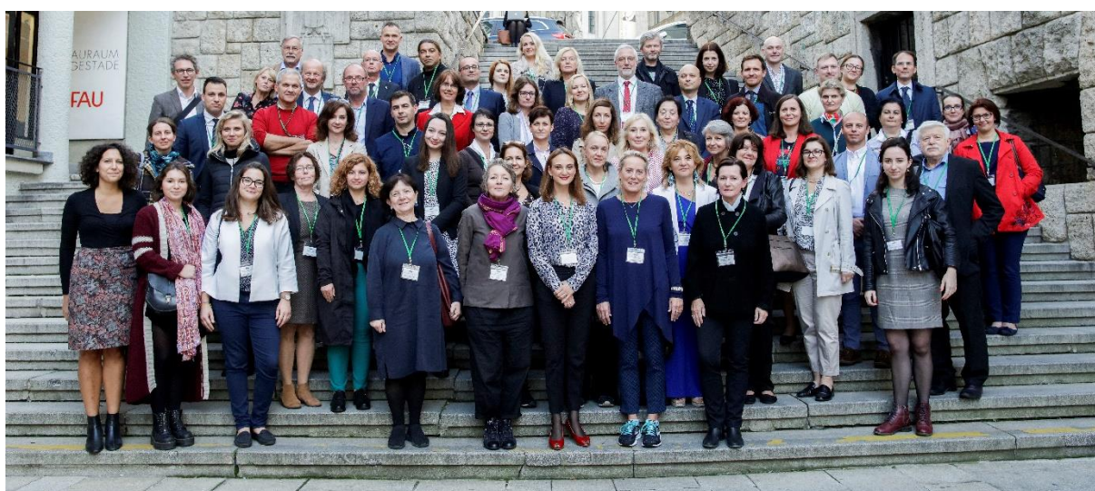
Setkání ve Vídni se zájemci o spolupráci na kulturních stezkách z evropských makroregionů.