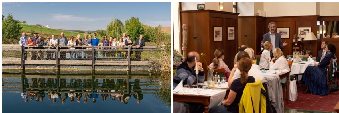
Účastníci studijní cesty při prohlídce Živé vody na Modré a na setkání s představiteli Zlínského kraje v Uherském Hradišti.

https://www.kr-zlinsky.cz/zastupci-kraju-z-moravy-a-slovenska-navstivili-velkomoravske-dedictvi-zlinskeho-kraje-fotogalerie-1114.html