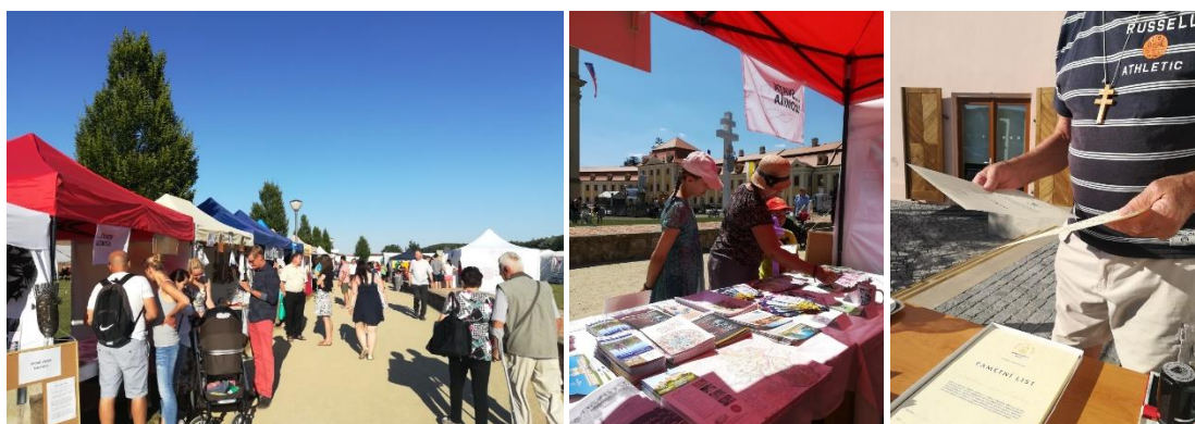
Na infostánku Cyrilometodějské stezky a při přebírání Pamětního listu u velehradského infocentra.