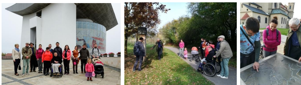
Na CM trase mezi Starým Městem a Velehradem během Filmšlapu.

https://www.clovekavira.cz/detail-galerie/c7bc2821-61ac-4e6f-9377-4248f3f20a0b