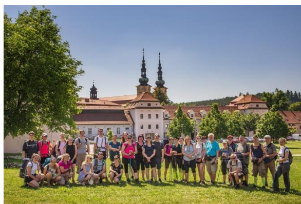
Zahájení etapového putování z Velehradu na Tetín