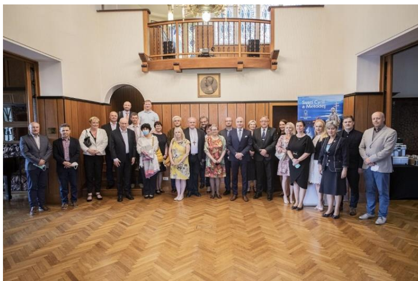
Číše vína v Bat'ově vile ve Zlíně