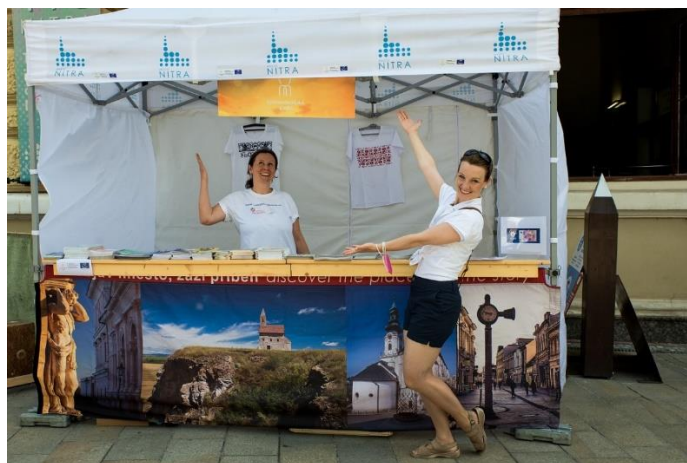
Informační stánek Cyrilometodějské stezky na pěší zóně Svatoplukova náměstí v Nitře, autor: M. Peterka.

Následující den byla Cyrilometodějská stezka prezentována na stánku na pěší zóně, který sloužil také jako jedno z míst, kde účastníci tradičního putování organizovaného Nitrianským samosprávným krajem dostali razítko do poutního pasu cestou z Dražovců na Nitrianský hrad.