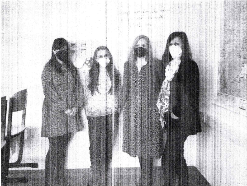
Fotografie zo stretnutia English Club, 15.11.2021