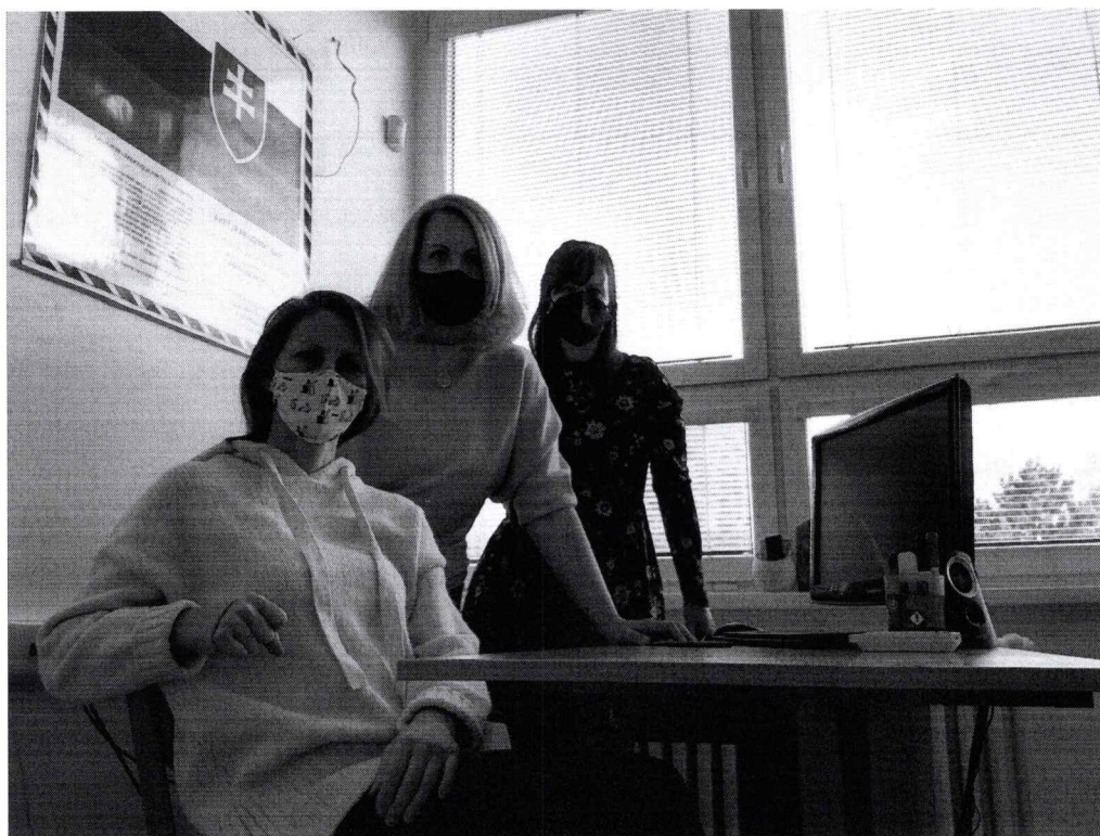
Fotografie zo stretnutia English club, 18.10.2021