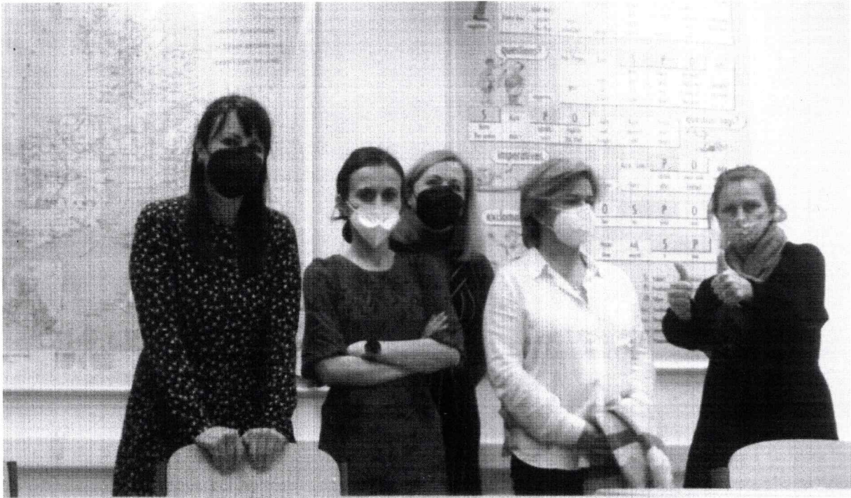
Stretnutie English club, 29.11.2021