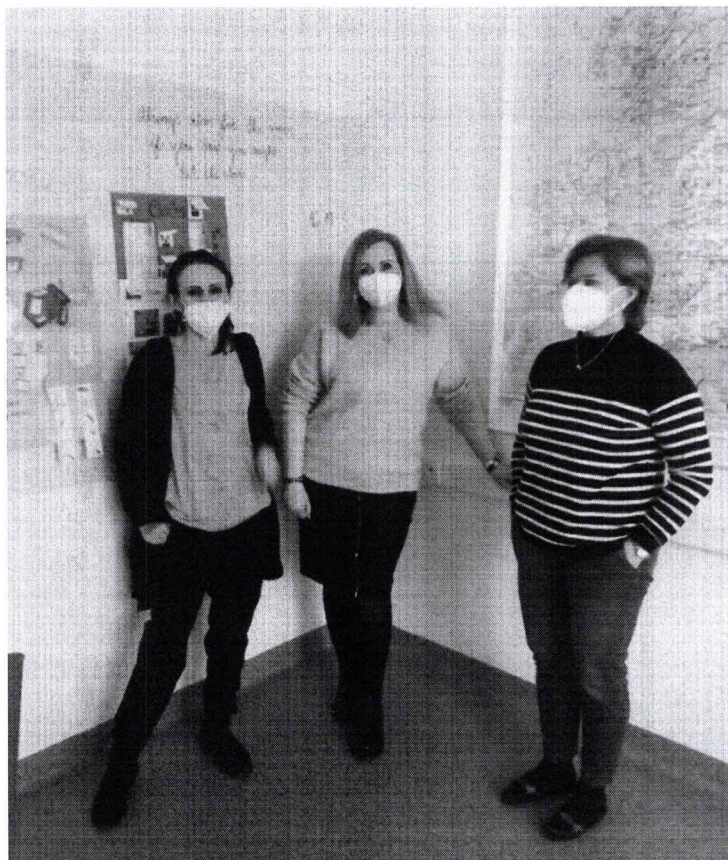
Stretnutie English club, 24.1.2022