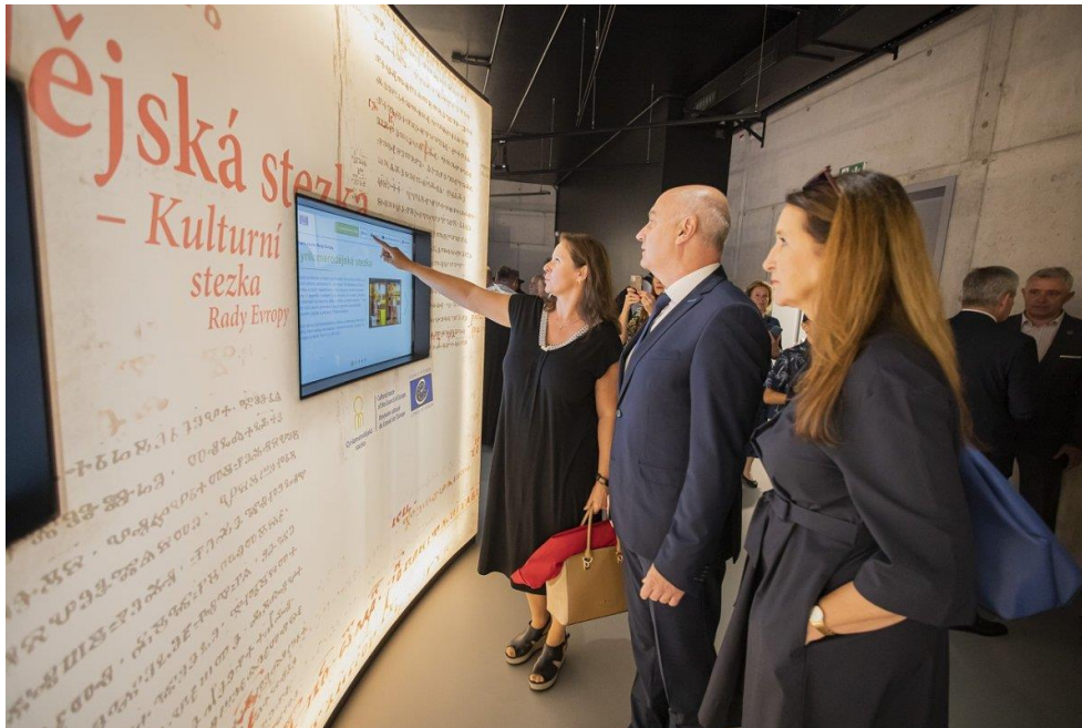
Interaktivn obrazovka o Cyriľmetodjsk stezce umstn v Cyriľmetodjskm centru ve Starm Mst u Uberskho Hradist.