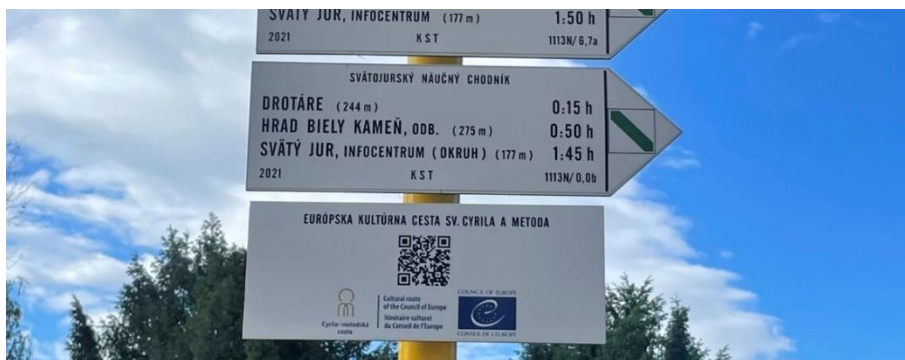
Cesta křížov a Svätajurský náučný chodník, Slovensko.