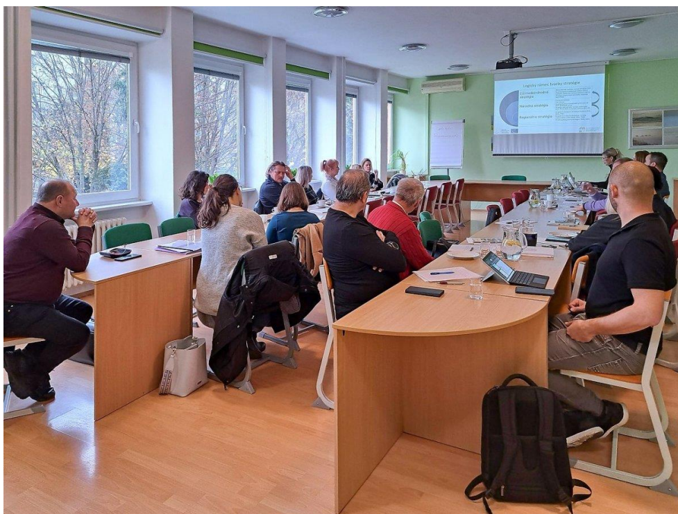
Jednání slovenských členů EKSCM k Národní strategii Cyrilometodějské cesty.

K Národní strategii Cyrilometodějské stezky v České republice proběhly v druhé polovině roku 2022 dvě schůzky. První schůzka se uskutečnila na Krajském úřadě Olomouckého kraje dne 9. 8. 2022 za účasti zástupců českých členů EKSCM. V rámci prvního jednání byla představena schválená Mezinárodní strategie Cyrilometodějské stezky do roku 2030, předpokládaná struktura Národní strategie a pracovní plán jejího zpracování. Druhá schůzka se uskutečnila na Krajském úřadě Zlínského kraje dne 1. 11. 2022, která proběhla formou workshopu. Ten byl zaměřený na návrhovou část Národní strategie Cyrilometodějské stezky v ČR. Formou diskuse všech zúčastněných byla definována vize, cíle a opatření.