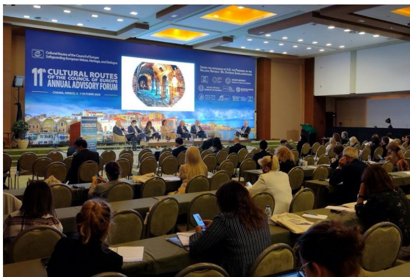
Výroční poradní fórum kulturních stezek v Chanii, Řecko.