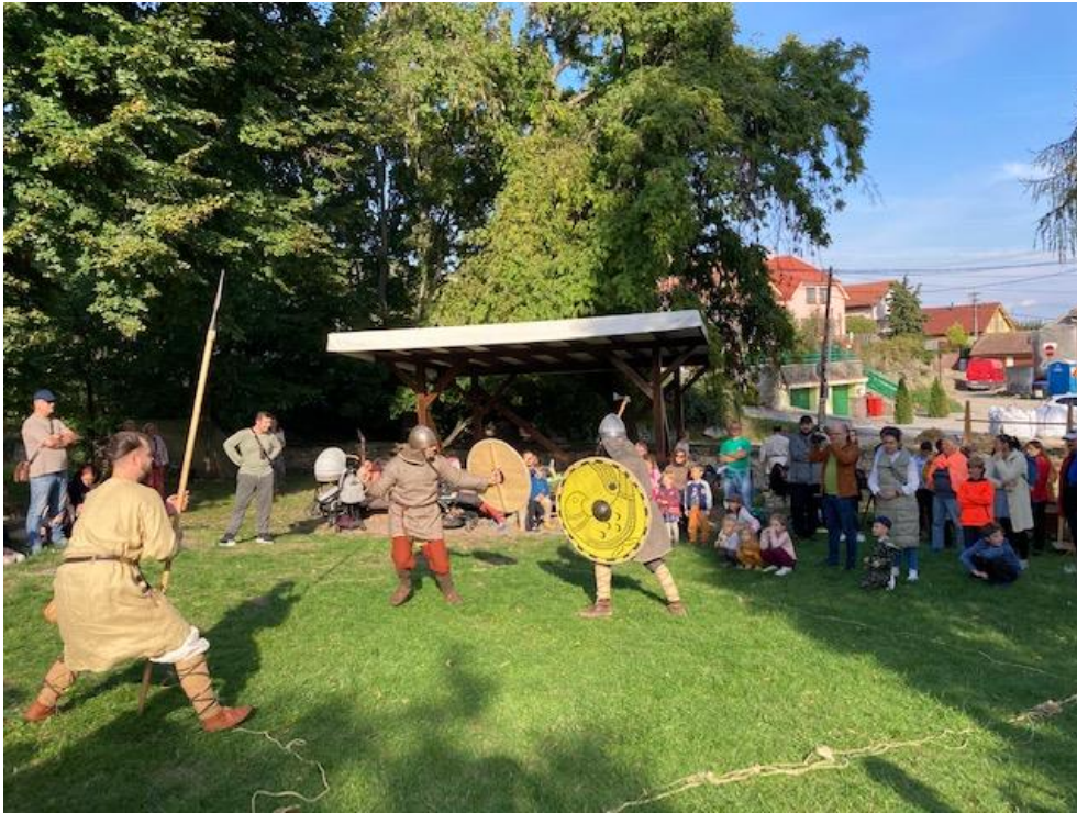
Event spojený s históriou Veľkej Moravy vo Svätom Juri, Slovensko.

V rámci podujatí sme v septembri spolu s mestom Svätý Jur a Bratislavským krajom otvorili aj dva náučné chodníky „Cesta krížov“, Cesta krížov (bratislavaregion.travel) a „Náučný chodník Neštich“ Európska kultúrna cesta sv. Cyrila a Metoda – Slovenský Dom Centrope . Obidva produkty sú označené originálnymi QR kódmi, obsahovo s ponukou tém Veľkej Moravy a Cyrilometodskej cesty. Týmto spôsobom vznikli nové výletno – poznávacie lokálne okruhy pre návštevníkov z centra mesta Svätý Jur, ako jedného z miest spojených s Cyrilometodskou cestou v Bratislavskom kraji.