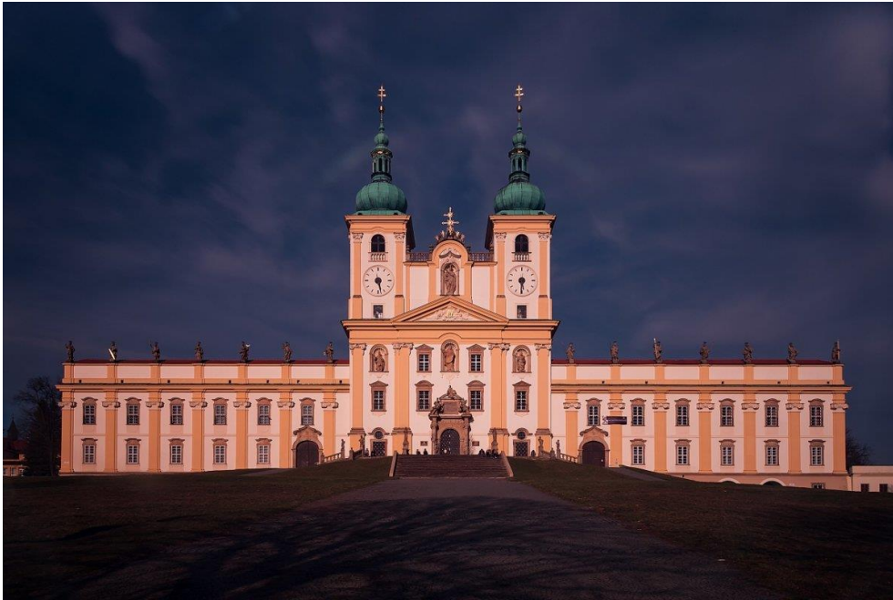
Bazilika Navštívení Panny Marie na Svatém Kopečku u Olomouce.