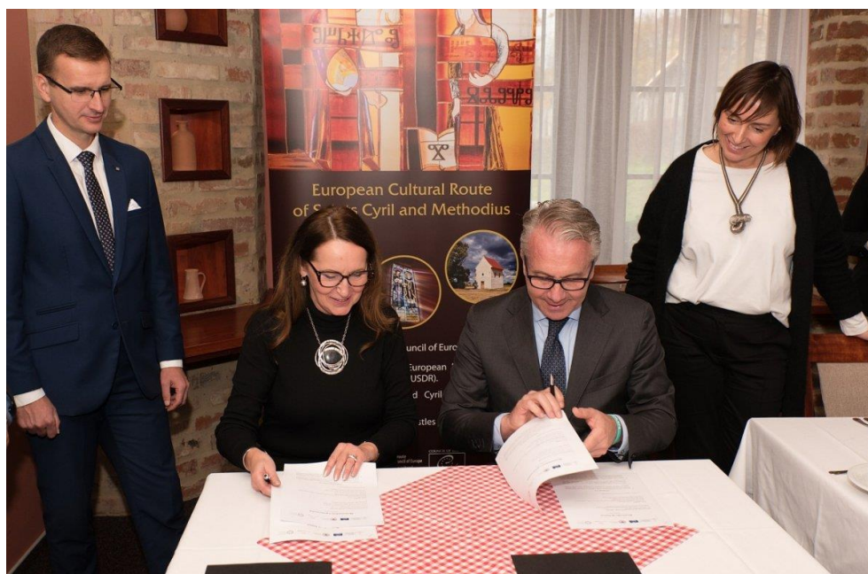
Podpis memoranda o spolupráci v hotelu Skanzen v Modré, Česká republika.

Zviditelnění Cyrilometodějské stezky v regionu Friuli Venezia Giulia je možné prostřednictvím některých stezek, které již na území existují, např. Cammino Celeste a Via Romea Strata, které procházejí Aquileí. Navázání této spolupráce přináší další příležitosti vzájemné propagace na mezinárodní úrovni a rozvoj společného turistického produktu.