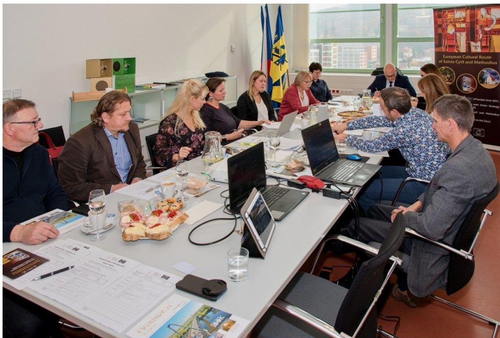
Valná hromada členů sdružení Evropská kulturní stezka sv. Cyrila a Metoděje ve Zlíně, Česká republika.