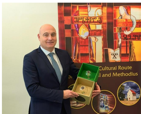
Ceny BIG SEE pro Cyrlometodějskou stezku.

Mezinárodní porota ceny BIG SEE udělila ve slovinské Lublani Cyrlometodějské stezce – Kulturní stezce Rady Evropy Hlavní cenu v kategorii Kreativní příběh jako zážitek a Cenu za design v cestovním ruchu v kategorii Kreativní příběh a identita jako zážitek. Předání ocenění proběhlo během Big Design Festivalu na lublaňském hradě ve čtvrtek 27. října za účasti zástupců sdružení Evropská kulturní stezka sv. Cyrila a Metoděje a dvou významných poutních míst – moravského Velehradu a slovinského Brezje.