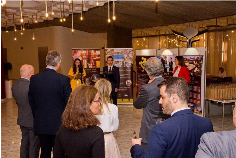
Vernisáž výstavy Evropská kulturní stezka sv. Cyrila a Metoděje v Evropském parlamentu