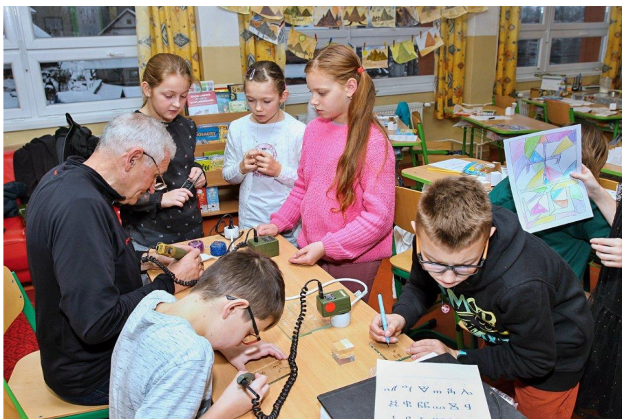
Workshop dětí ZŠ Boršice, Česká republika a ZŠ Terchová, Slovensko.