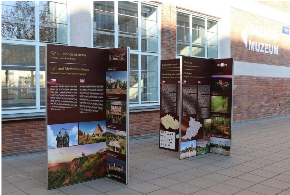
Výstava osmi venkovních panelů před budovou 14|15 BAŤŮV INSTITUT ve Zlíně, Česká republika.