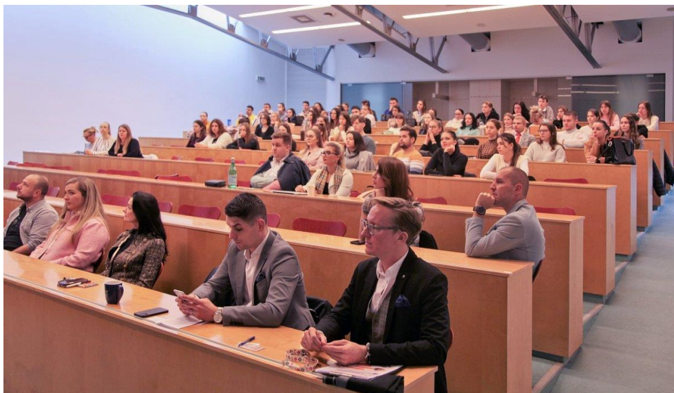
Týždeň vedy a techniky 2022 na UKF v Nitre, Slovensko.

V rámci novembrového Týždňa vedy a techniky 2022 (7.-11.11.2022) na Univerzite Konštantína Filozofa v Nitre bola predstavena študentom ako aj odbornej verejnosti Cyrilo-metodská cesta a putovanie po nej ako spôsob sebarozvoja, ako cestu za poznáním slovanského kultúrneho dedičstva, za pokáním či nájdením seba samého. Študentov oslovilo putovanie najmä v tom, že im umožňuje dokázať samým sebe aj svojmu okoliu, že vedia mať cieľ a ísť si za ním. Zároveň im umožňuje prekonať svoje hranice – fyzické aj mentálne.