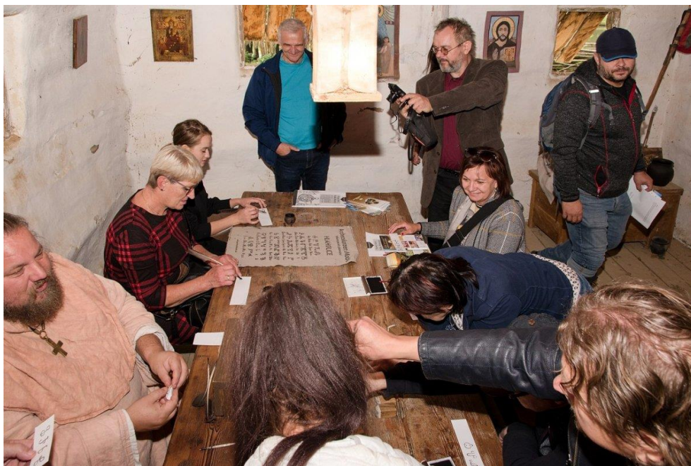
Práce s hlaholicí v Metodějově škole v Archeoskanzenu Modrá, Česká republika.