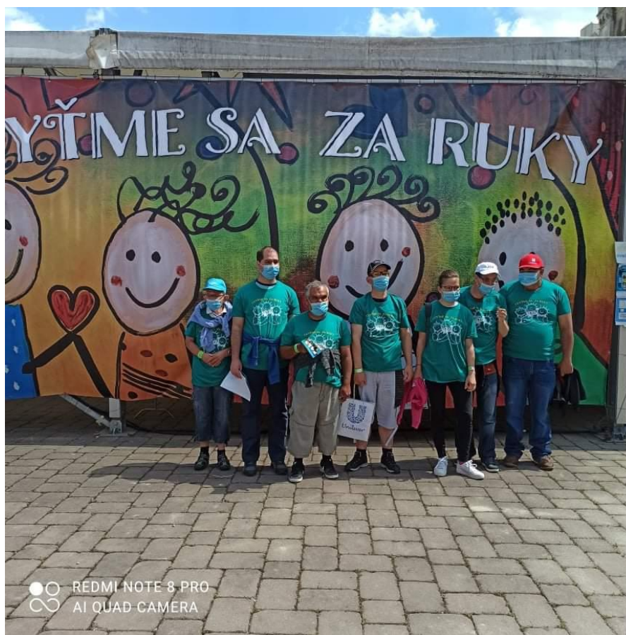
KONCERT V GALANTE