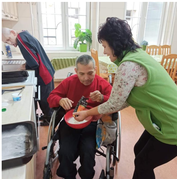
PEČIEME SI KOLÁČIKY