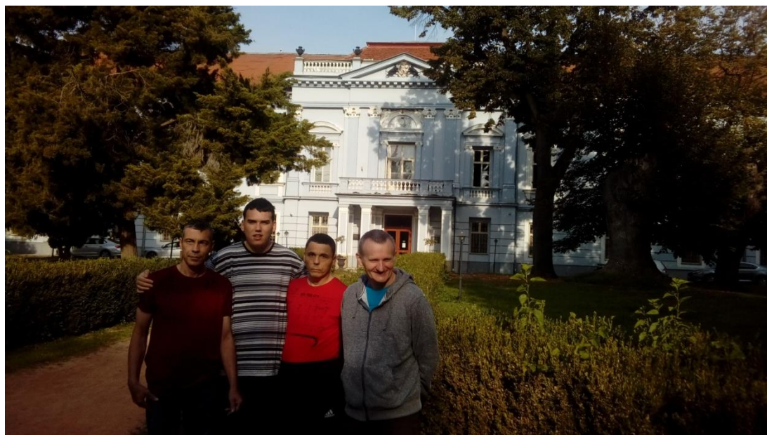
VÝLET DO MOJMÍROVIC