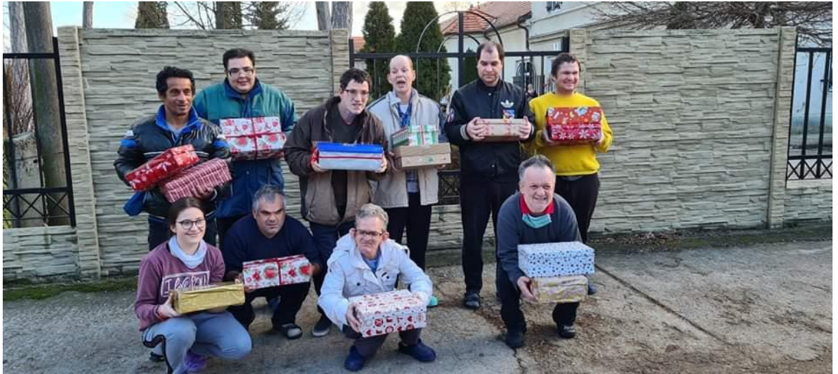
KOĽKO LÁSKY SA VOJDE DO KRABICE OD TOPÁNOK