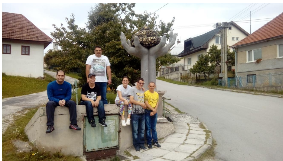
VÝLET DO NOVEJ LEHOTY