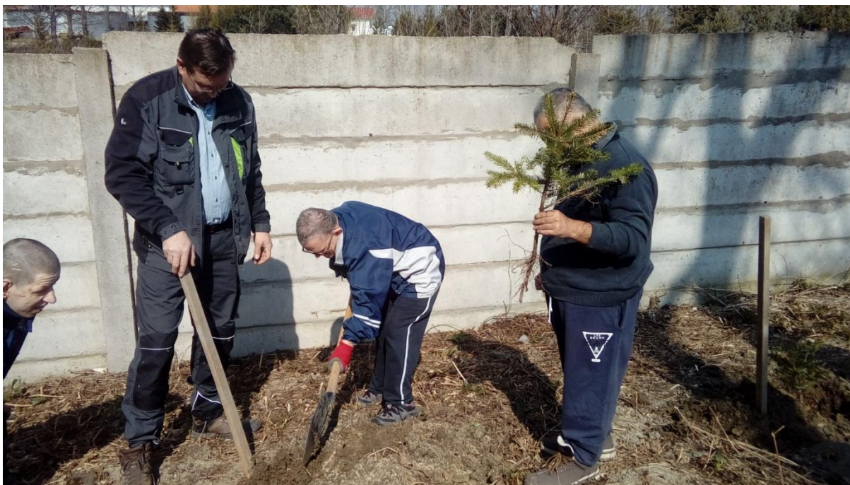
SADENIE NORMANDSKÝCH JEDLIČIEK