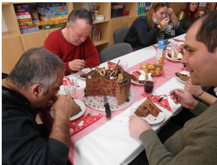
OSLAVA 40. NARODENÍŇ PSS