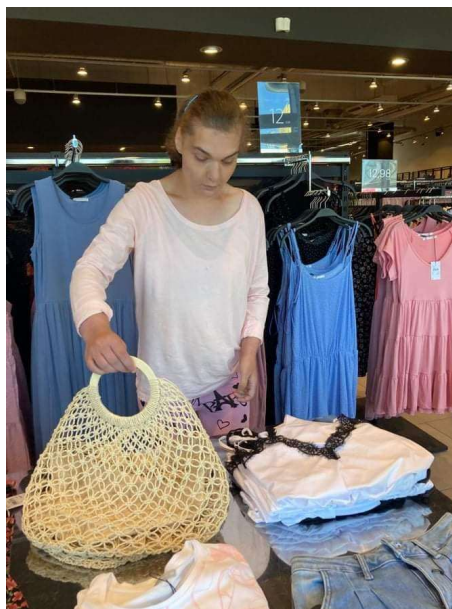
Na nákupoch v Senici