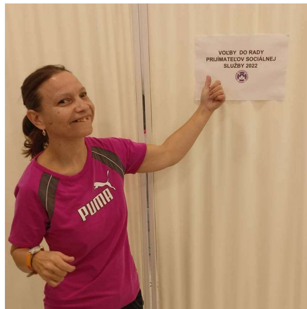
Voľby do novej Rady prijímateľov sociálnej služby