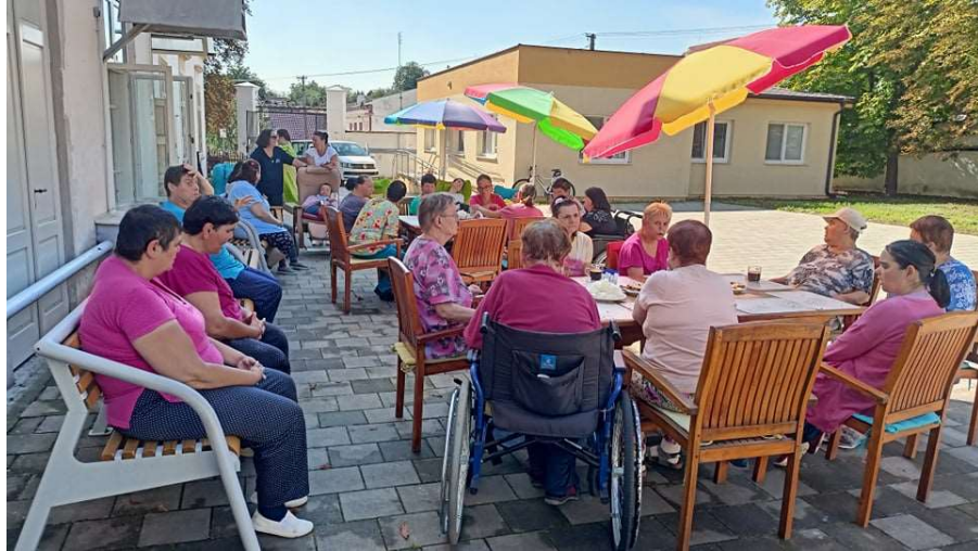
Kaviareň na nádvorí kaštieľa