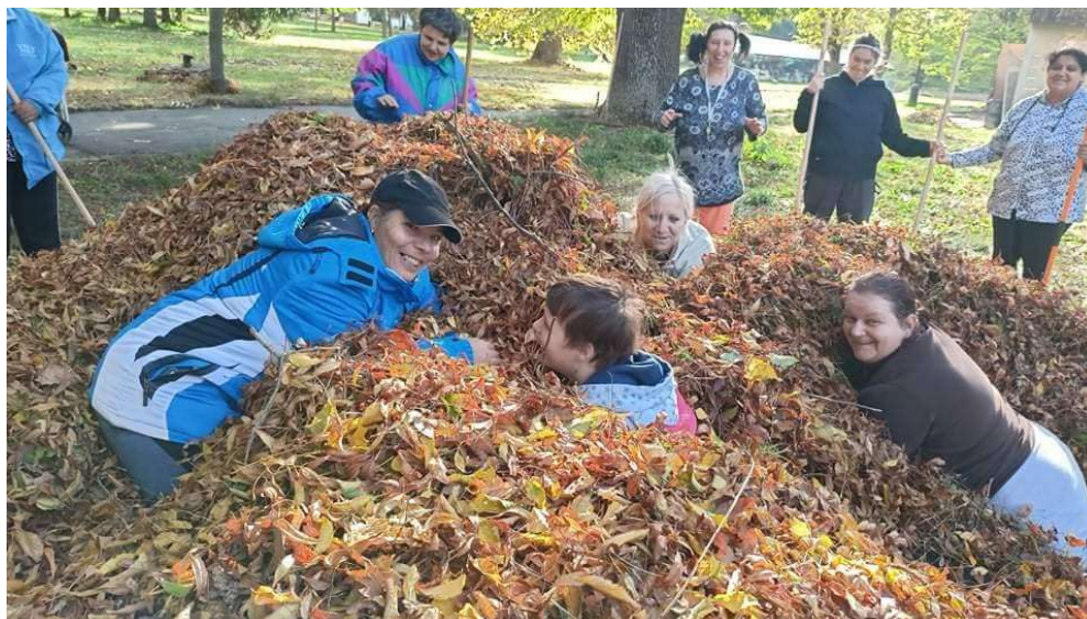
Jesenná brigáda v parku