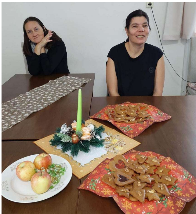
Tradičné pečenie vianočných medovníkov