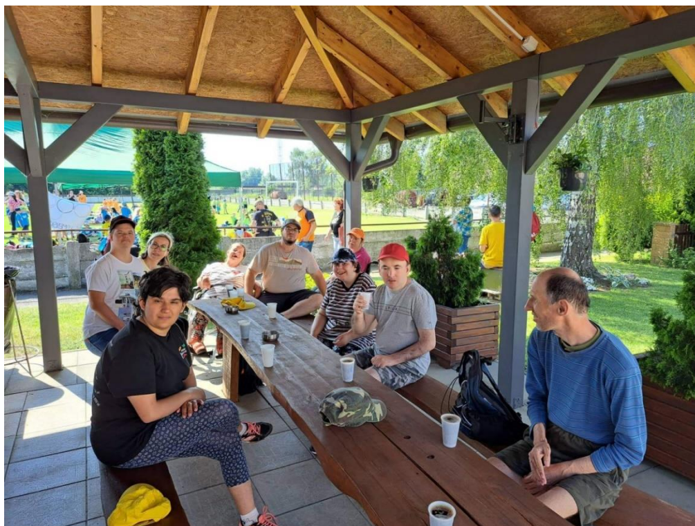
Olympiáda na štadióne v Šintave