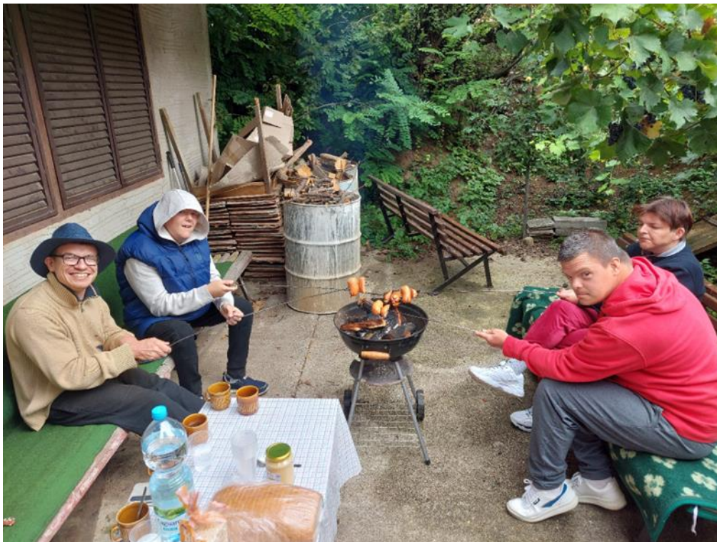
Výlet s opekačkou na Katarínke