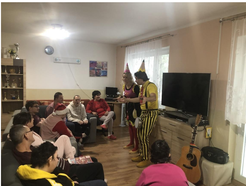
Ceruzko a Farbička