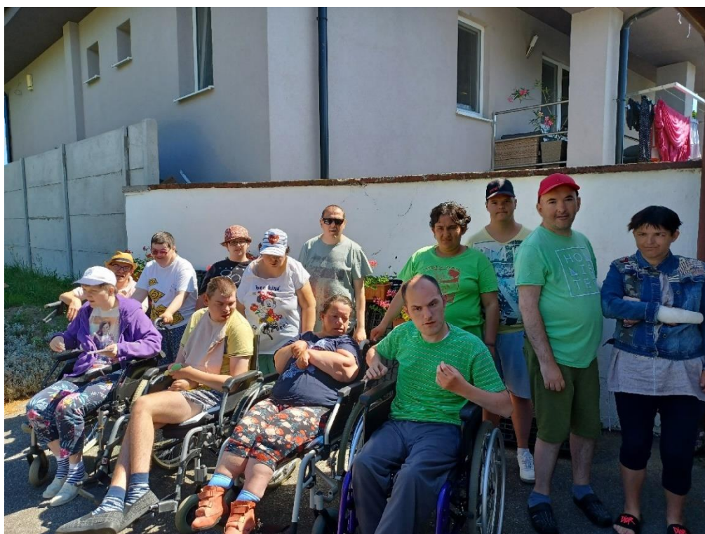
Deň najlepších priateľov