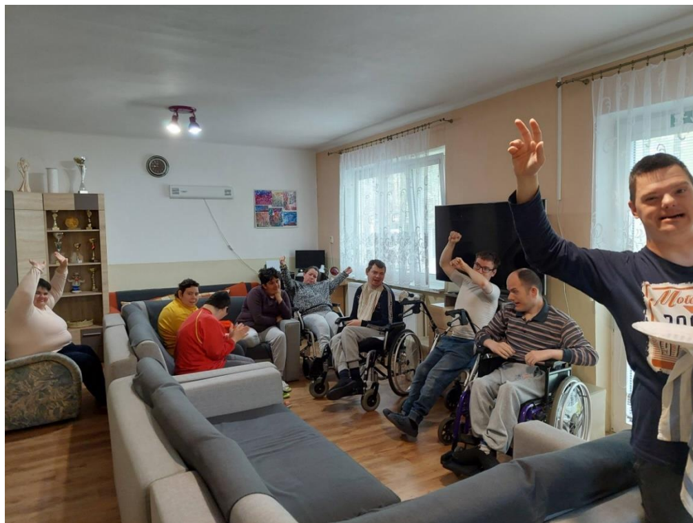
Medzinárodný deň šťastia