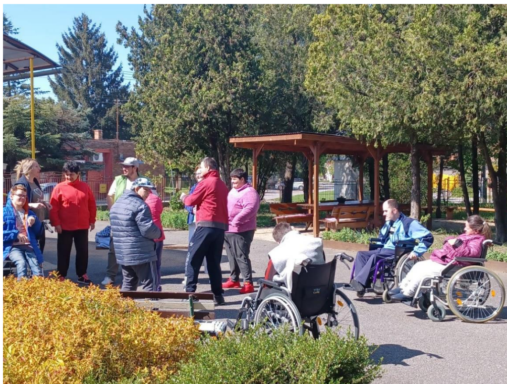
Medzinárodný deň tanca