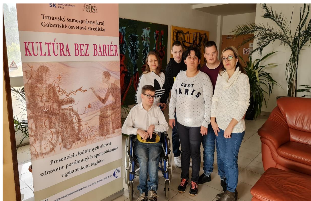
Kultúra bez bariér – Sládkovičovo