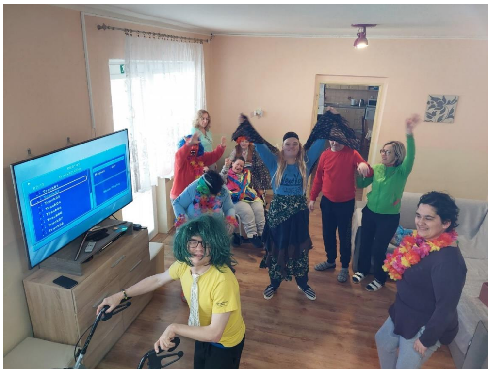
Karneval a Fašiangy