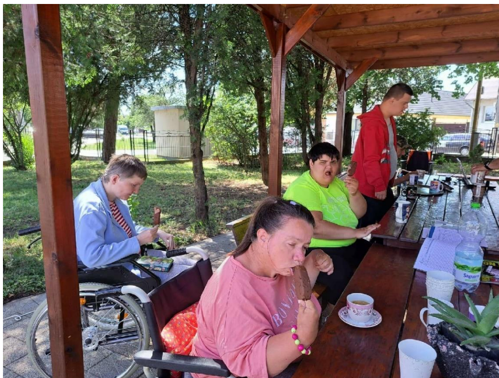
Deň čokoládovej zmrzliny