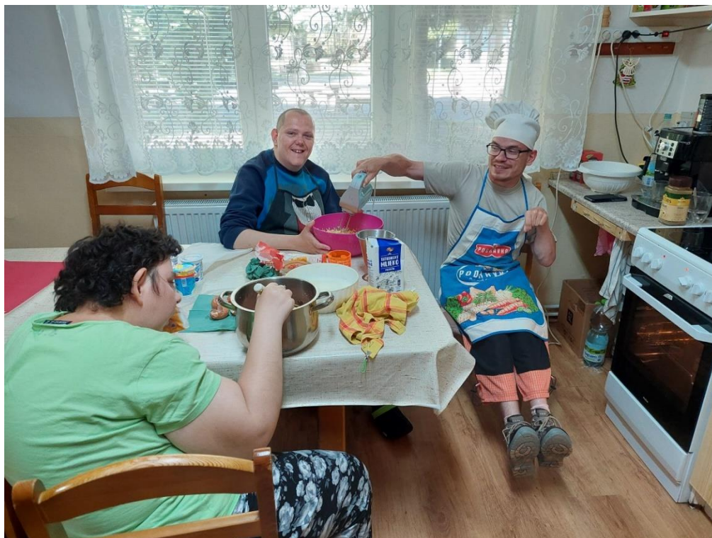
Svetový deň pečenia