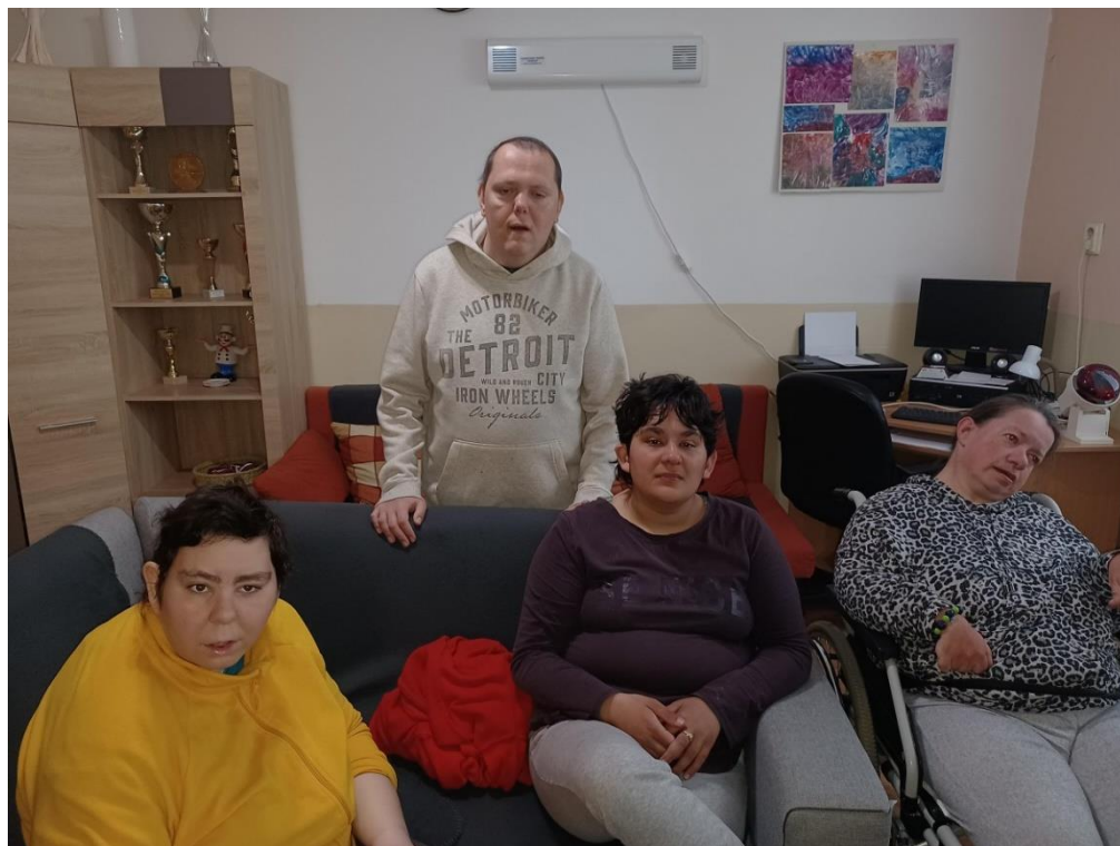
Medzinárodný deň zábavy