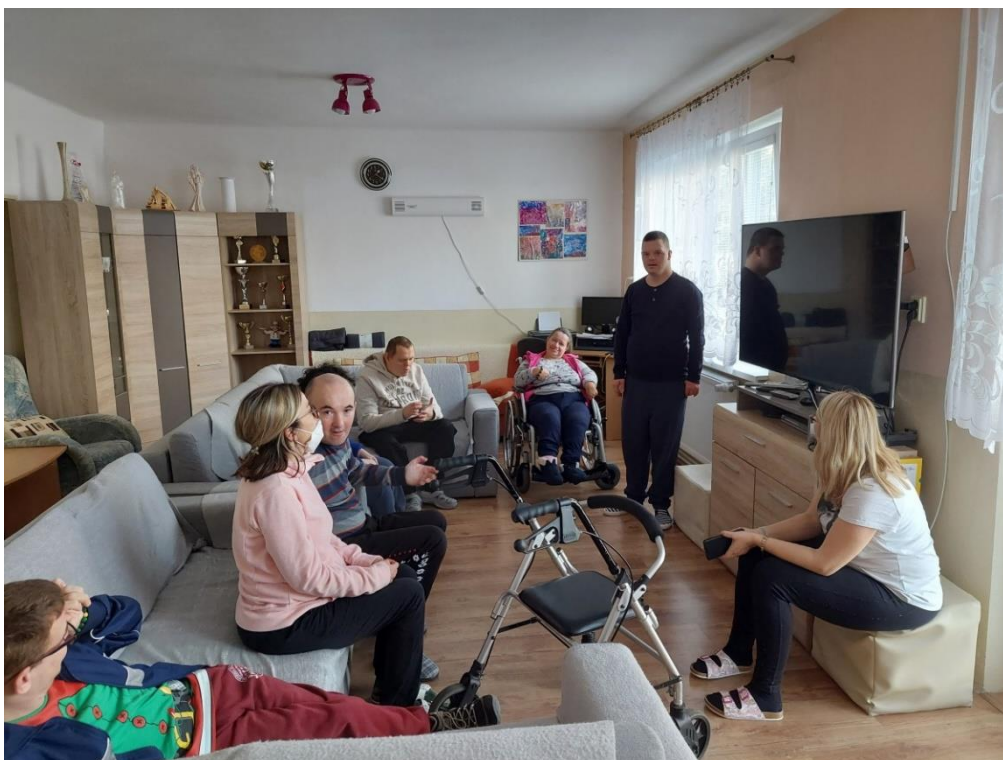
Medzinárodný deň komplimentov