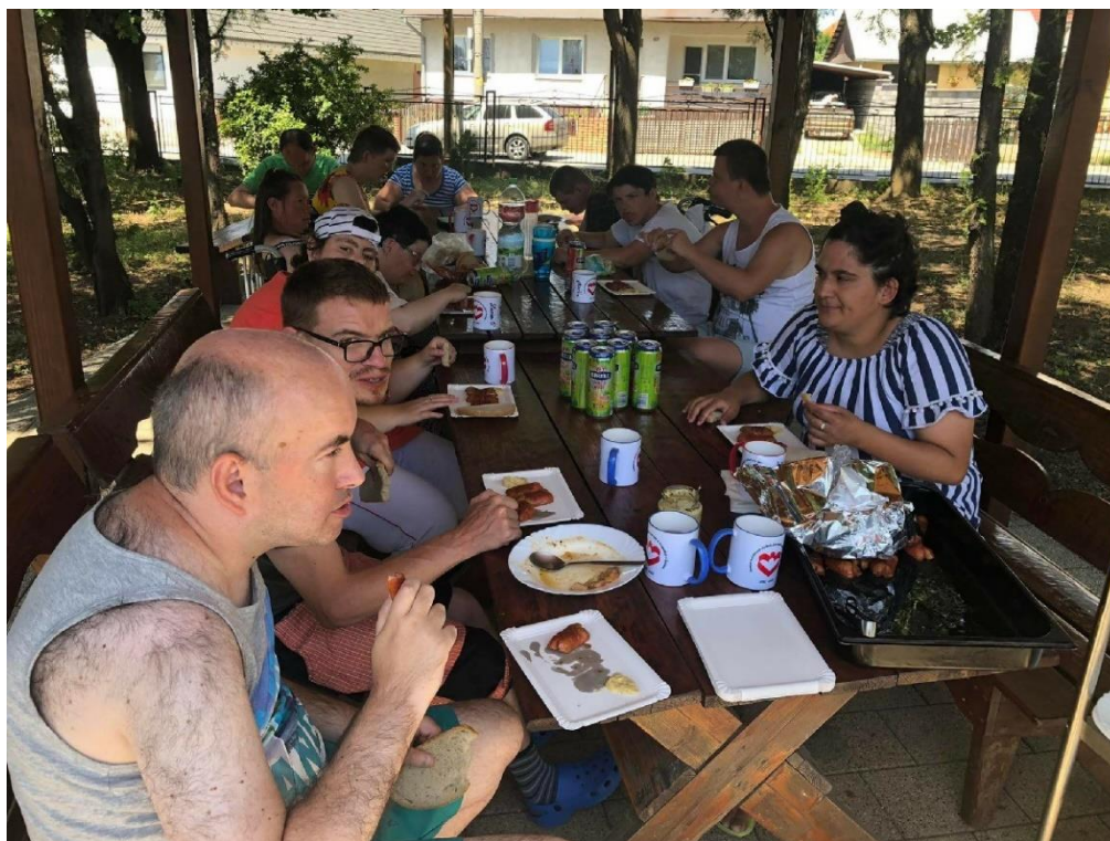
Medzinárodný deň pikniku