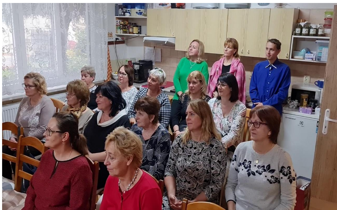
Stretnutie s bývalými zamestnancami