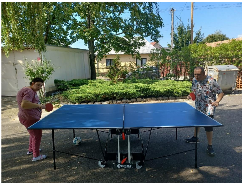
Deň športu a pohybu