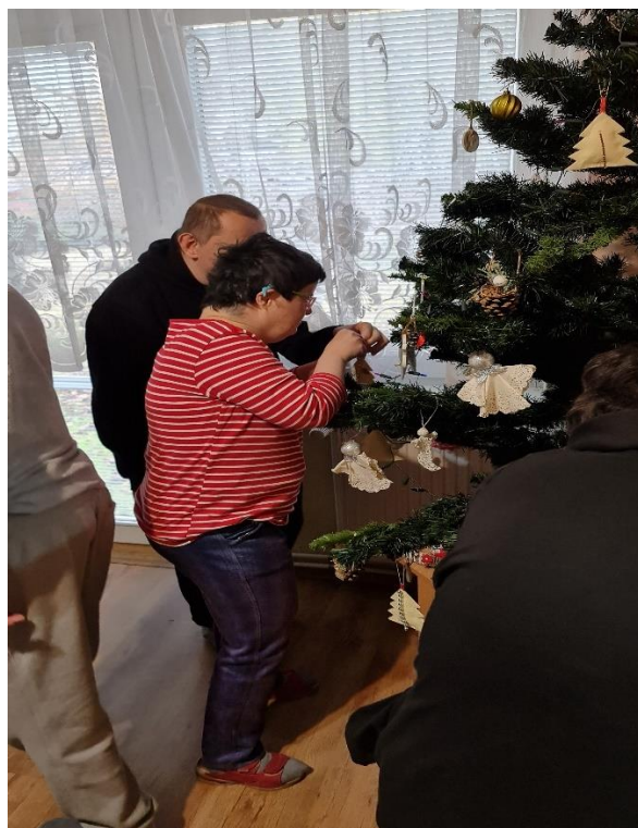
Zdobenie vianočného stromčeka