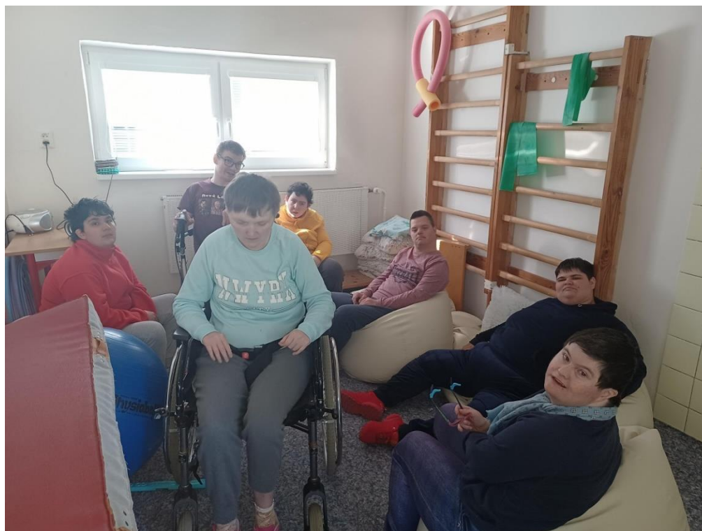
Deň pokoja a relaxácie