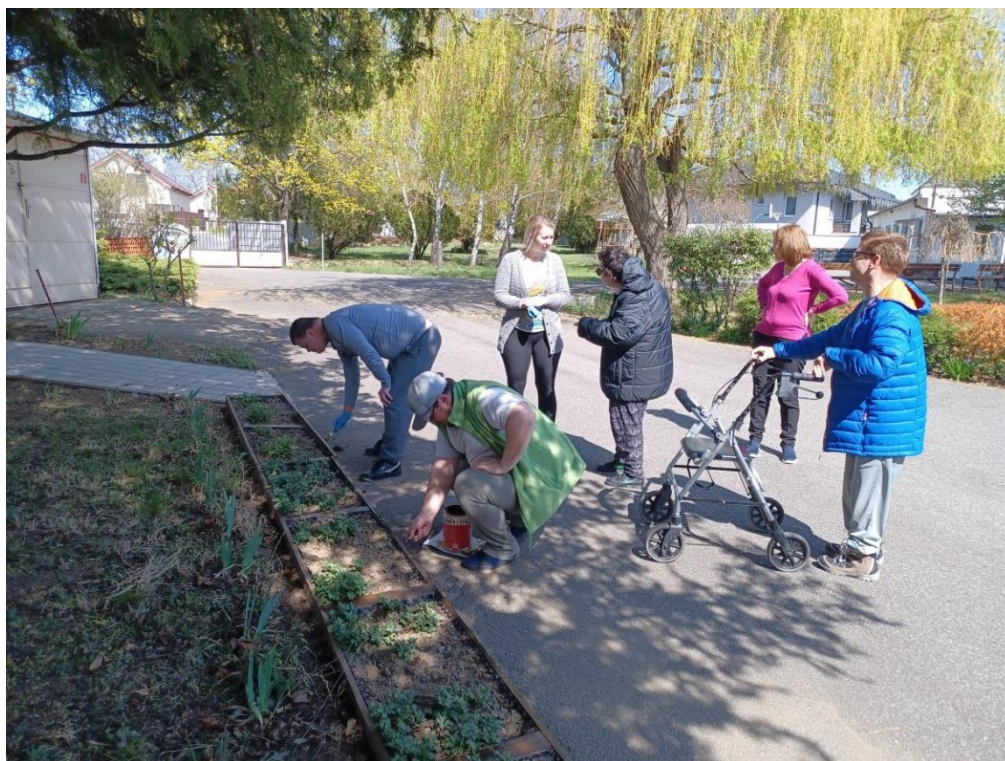
Jarná úprava areálu