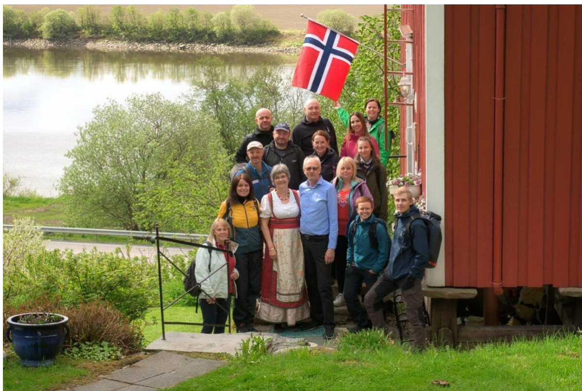
Zástupci Cyrilometodějské stezky a Svatoolafské cesty na farmě Sundet.