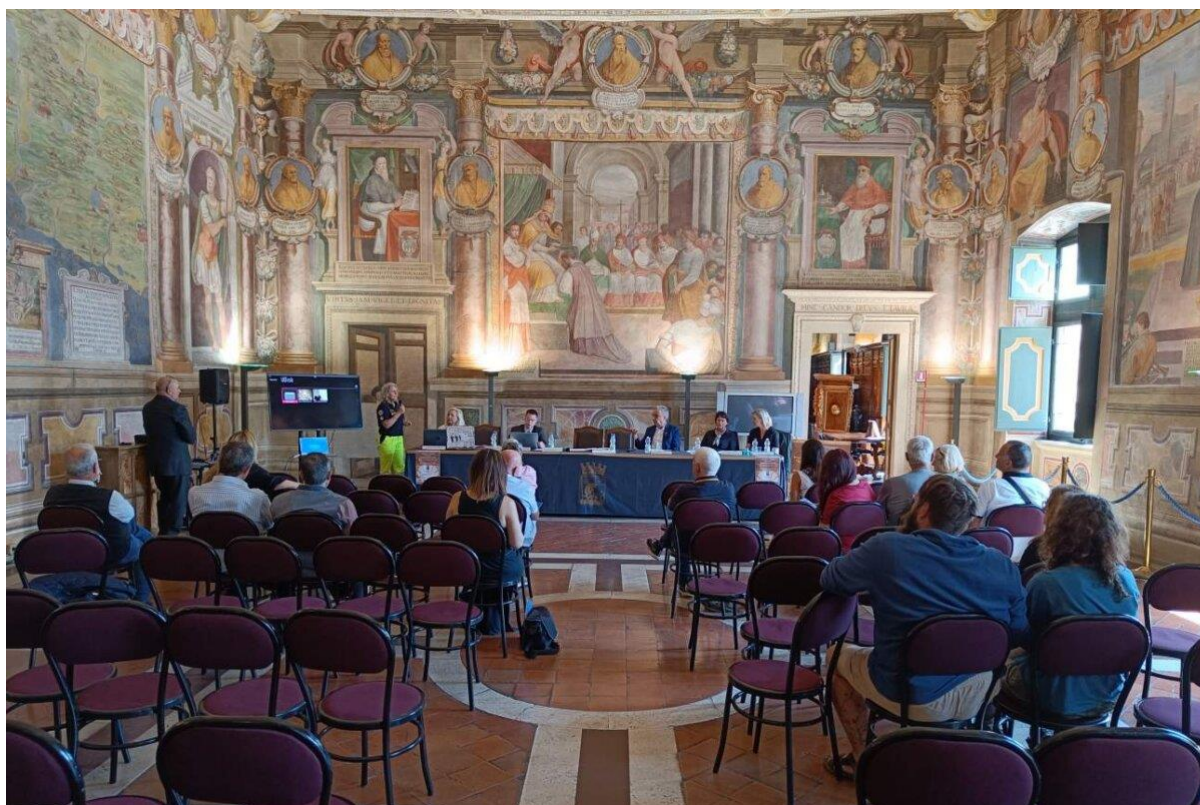
Tisková konference Cyrilometodějské stezky, Via Francigeny a Romea Strata v prezentačním sále města Viterbo.