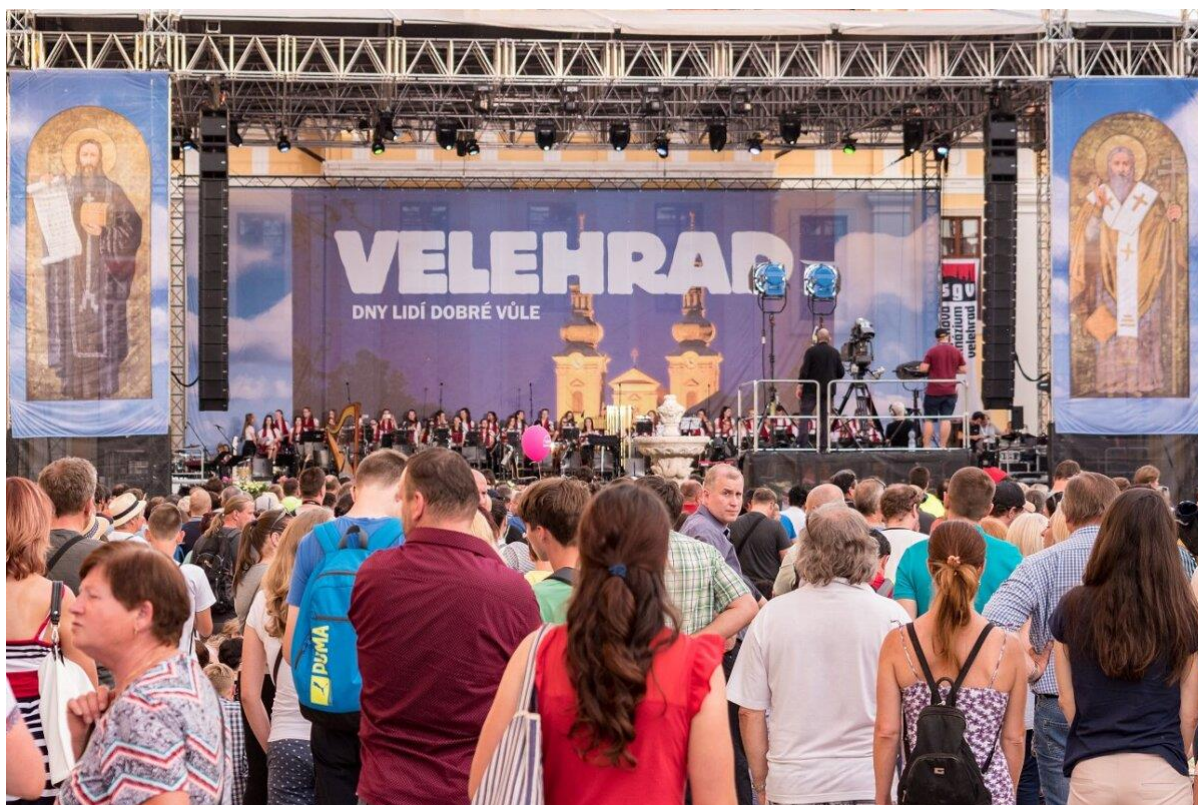
Večer lidí dobré vůle na Velehradě.