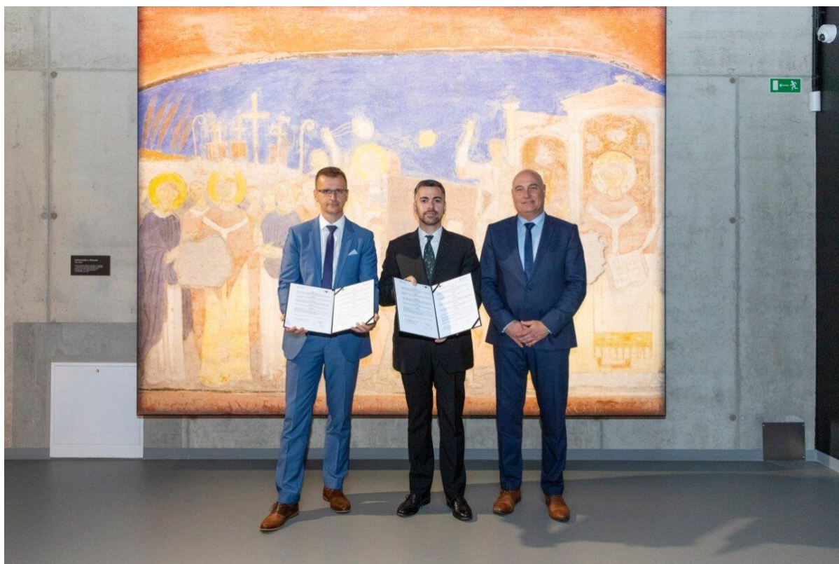
Podpis dohody o spolupráci v Cyrilometodějském centru ve Starém Městě.