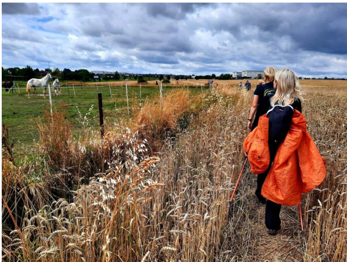
Pěší putování po Cyrilometodějské stezce z Levého Hradce do Kácova.