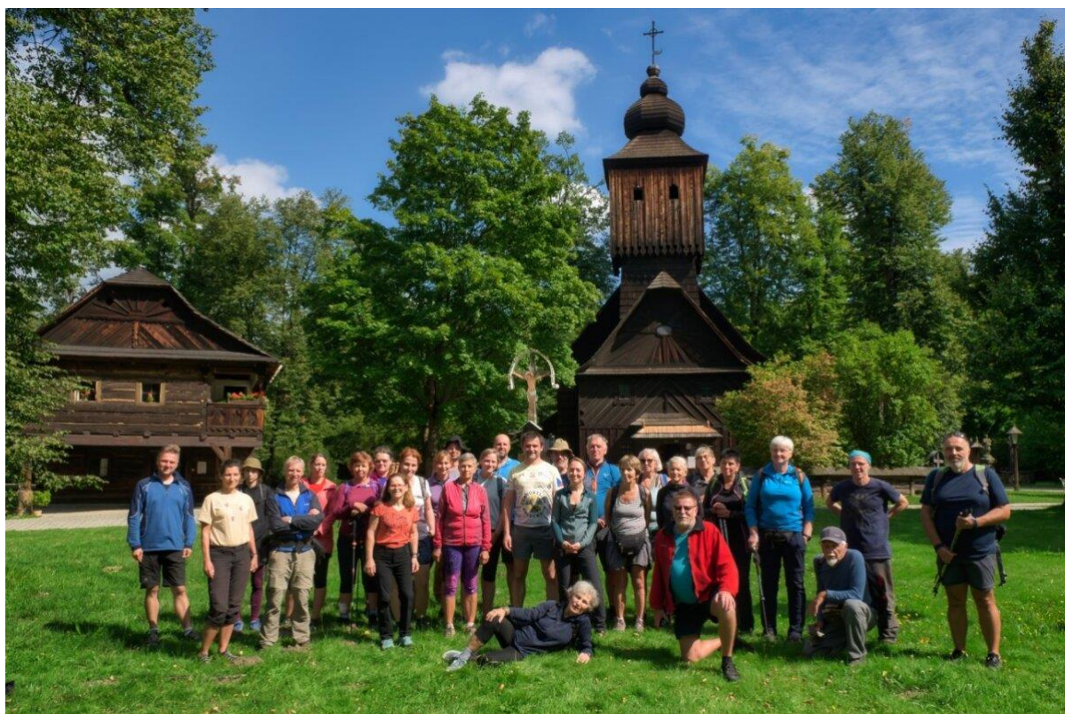
Poutníci ve Valašském muzeu v přírodě v Rožnově pod Radboštěm.