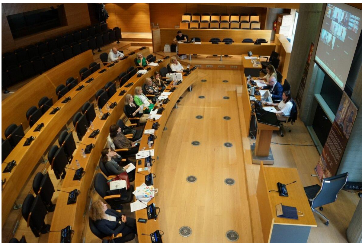
Jednání Valné hromady sdružení EKSCM na radnici města Soluň.