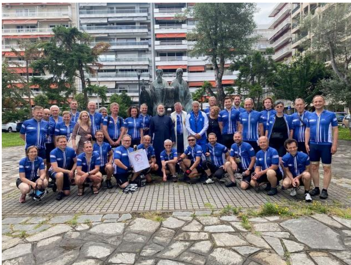
Společná fotografie účastníků cyklopoutě u sousoší sv. Cyrila a Metoděje v Soluni.