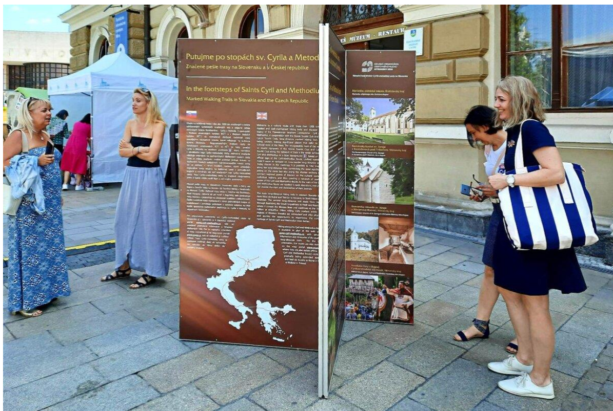
Venkovní panely Cyrilometodějské stezky v Nitře.