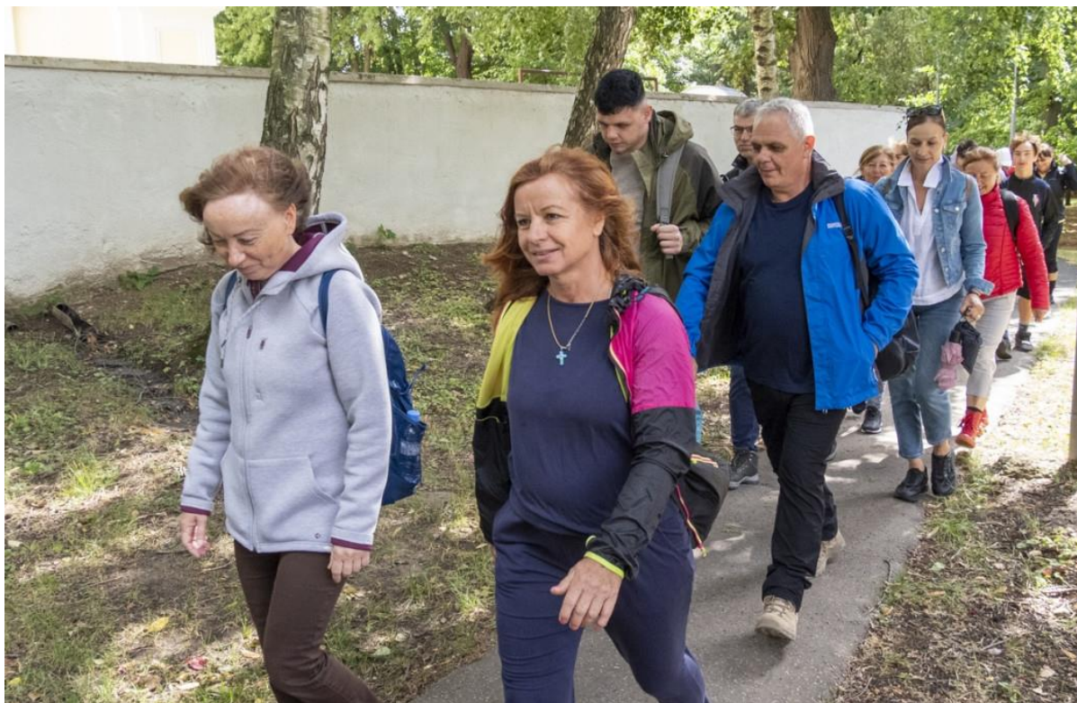
Putování z Močenku do Nitry.