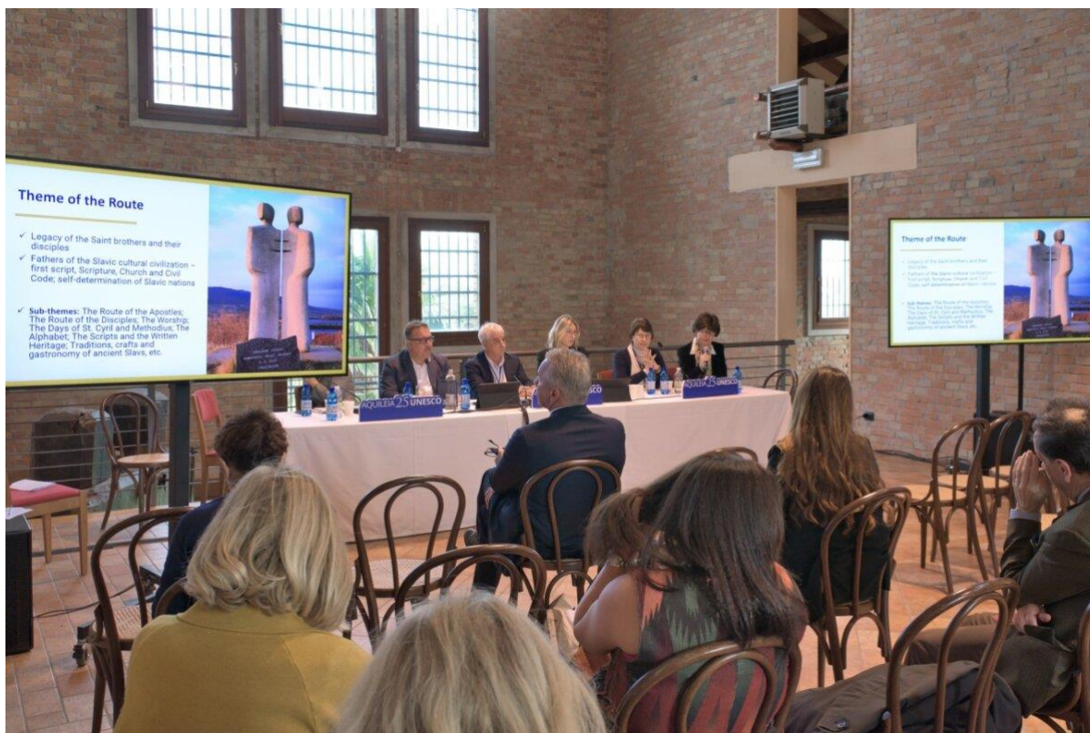
Představení Cyrilometodějské stezky na mezinárodní konferenci kulturních stezek procházejících italským městem Aquileia.