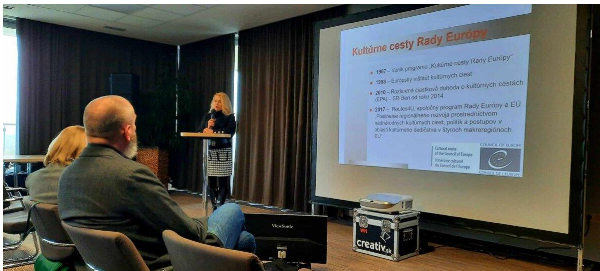
Konferencia o kultúrnych stezkách v Bratislave na Slovensku.