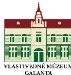
Dom ľudového bývania v Matúškove

Vlastivedné múzeum v Galante sídli v historickej budove v centre mesta vedľa rímsko-katolíckeho kostola a farského úradu.