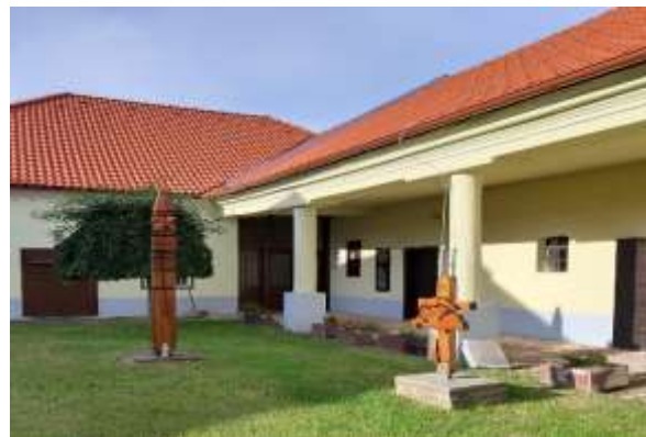
Vlastivedný dom v Šamoríne