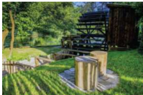
Vodný mlyn v Dunajskom Klátove