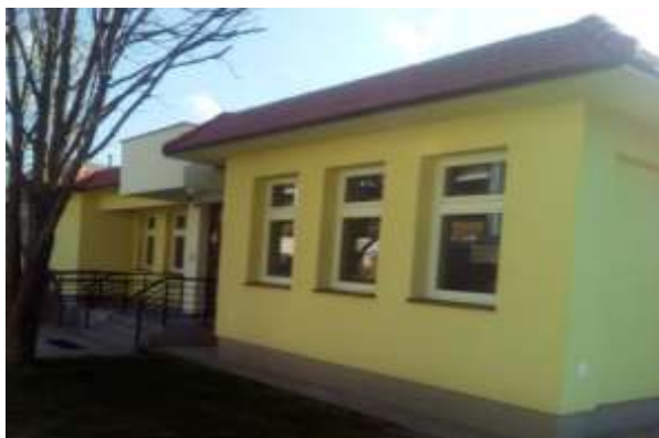
Výstavná sieň múzea