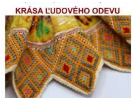
Paličkovaná babková čipka dokument bohatstva ľudového odevu západného Slovenska

Paličkovaná babková čipka, výstava o bohatstve ľudového odevu západného Slovenska