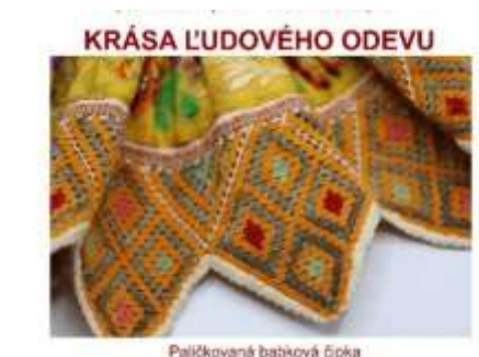
Paličkovaná babková čipka dokument bohatstva ľudového odevu západného Slovenska

Paličkovaná babková čipka, výstava o bohatstve ľudového odevu západného Slovenska