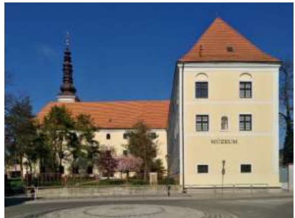
Hlavná budova ZSM – bývalý kláštor klarisiiek

Sídli v budove bývalého kláštora klarisiiek, ktorý sa v Trnave spomína už v roku 1239. Kláštor patril reholi až do roku 1782, kedy cisár Jozef II. zrušil rád klarisiiek. Budova sa následne stala všeobecnou vojenskou nemocnicou a neskôr nemocnicou pre psychicky chorých vojakov. V roku 1954 bola pridelená Krajskému múzeu v Trnave. V r. 1960 zmenila inštitúcia názov na Západoslovenské múzeum v Trnave.