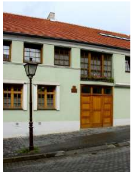
Knižnica a študovňa

Posledným objektom ZSM je Knižnica na Múzejnej ulici 2, kde sa nachádza študovňa, bádateľňa, príručná odborná knižnica pre zamestnancov a verejnosť a konzervátorské pracovisko.