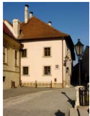
Múzeum knižnej kultúry

Súčasťou ZSM je Múzeum knižnej kultúry – Oláhov seminár objekt z roku 1561. Múzeum je zamerané predovšetkým na dejiny knižnej kultúry a zároveň prezentuje tvorbu trnavského medailéra Williama Schiffera.