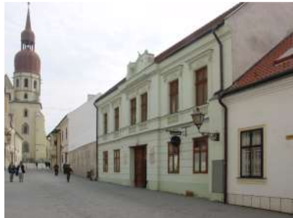
Dom hudby M. S. Trnavského

K ZSM patrí aj Dom hudby Mikuláša Schneidera Trnavského, kde sa nachádza pamätná izba hudobného skladateľa M. S. Trnavského a stála expozícia Dobra (rezofinických gitár).