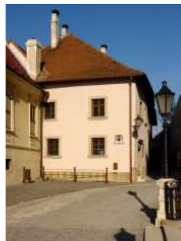
Múzeum knižnej kultúry

Súčasťou ZSM je Múzeum knižnej kultúry – Oláhov seminár objekt z roku 1561. Múzeum je zamerané predovšetkým na dejiny knižnej kultúry a zároveň prezentuje tvorbu trnavského medailéra Williama Schiffera.