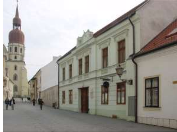
Dom hudby M. S. Trnavského

K ZSM patrí aj Dom hudby Mikuláša Schneidera Trnavského, kde sa nachádza pamätná izba hudobného skladateľa M. S. Trnavského a stála expozícia Dobra (rezofinických gitár).