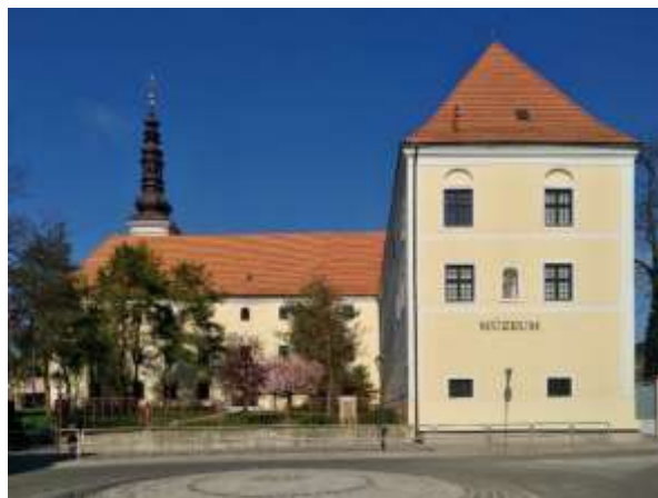
Hlavná budova ZSM – bývalý kláštor klarisiek

Západoslovenské múzeum v Trnave vzniklo v roku 1954 najskôr s názvom Krajské múzeum v Trnave. V roku 1960 bolo premenované na Západoslovenské múzeum. Sídli v budove bývalého kláštora klarisiek, ktorý sa v Trnave spomína už v roku 1239. Kláštor patrilo reholi až do roku 1782, kedy cisár Jozef II. zrušil rád klarisiek. Budova sa následne stala všeobecnou vojenskou nemocnicou a neskôr nemocnicou pre psychicky chorých vojakov. V roku 1954 bola pridelená Krajskému múzeu v Trnave. V r. 1960 zmenila inštitúcia názov na Západoslovenské múzeum v Trnave.