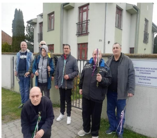
Šibačka v DSS Medveďov