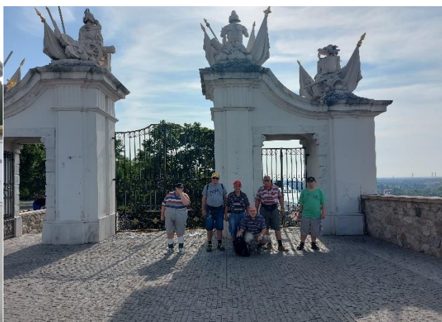
Výlet v Bratislave