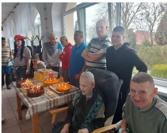
Narodeninová a meninová oslava