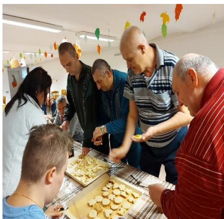
Hra na cukrára