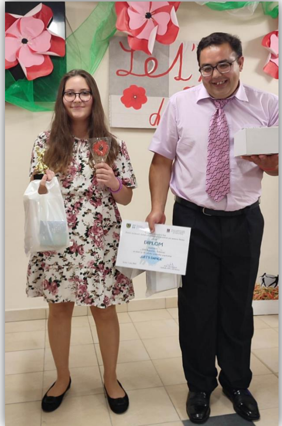
LET'S DANCE V SENICI