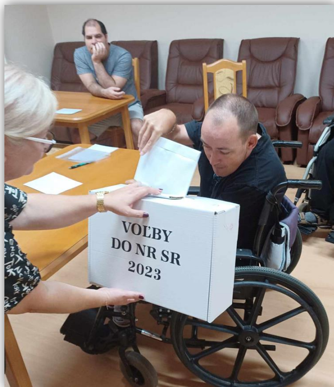
VOĽBY DO NR SR