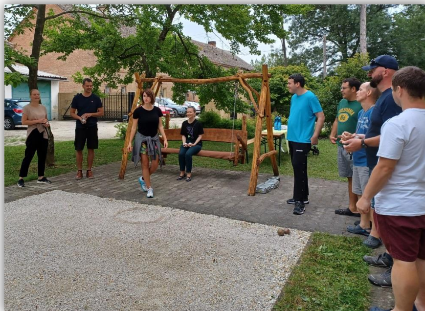
PETANGUE S PRIATEĽMI Z HDE BRATISLAVA