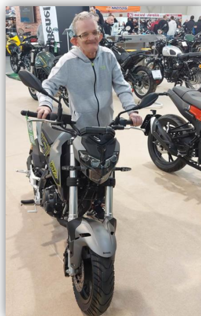
VÝSTAVA MOTORIEK V INCHEBE