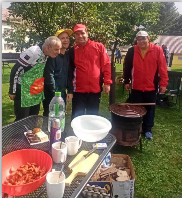
KOTLÍKOVÉ VARENIE V ČECHÁCH – DOMOV LIDMAŇ