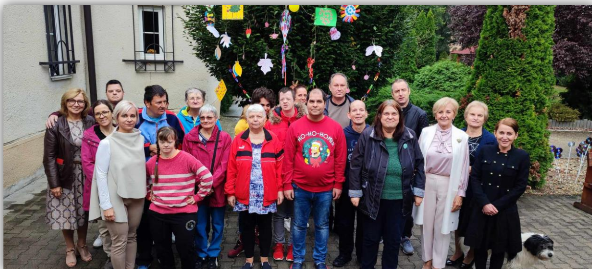
VYTVOR STROM ŽIVOTA