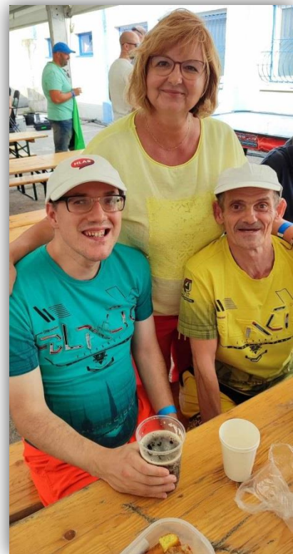
VARENIE GULÁŠU V ŠALI