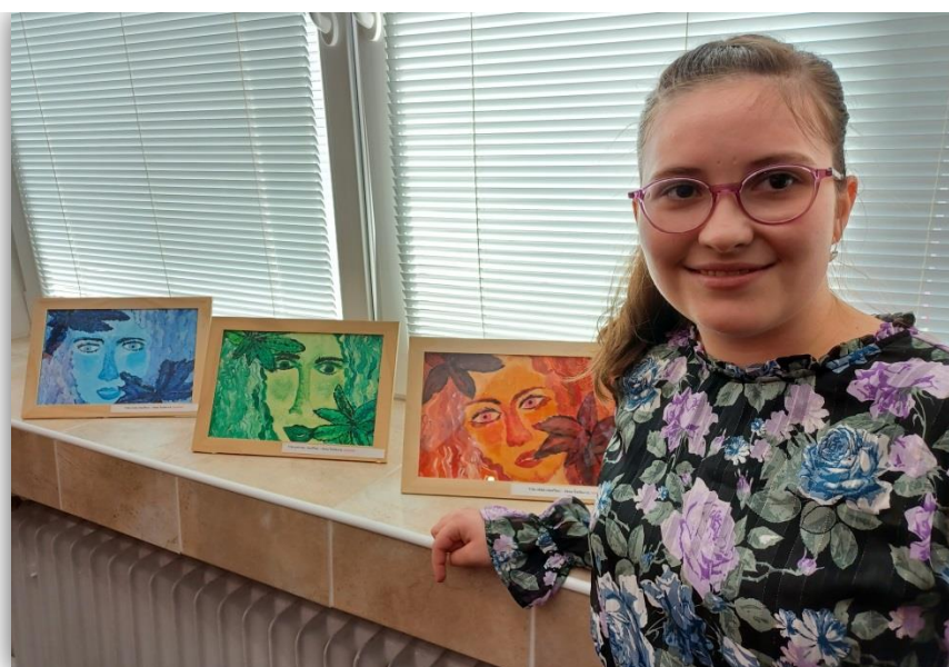
VÝTVARNÝ SALÓN V NOVÝCH ZÁMKOCH