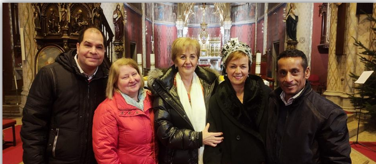
VIANOČNÝ KONCERT V PRAHE