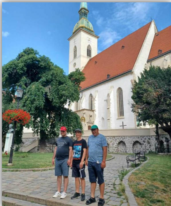
POTULKY PO BRATISLAVE