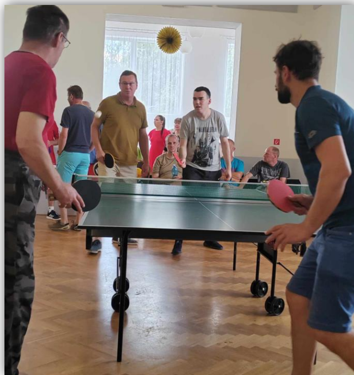
TURNAJ V STOLNOM TENISE V TRENČÍNE