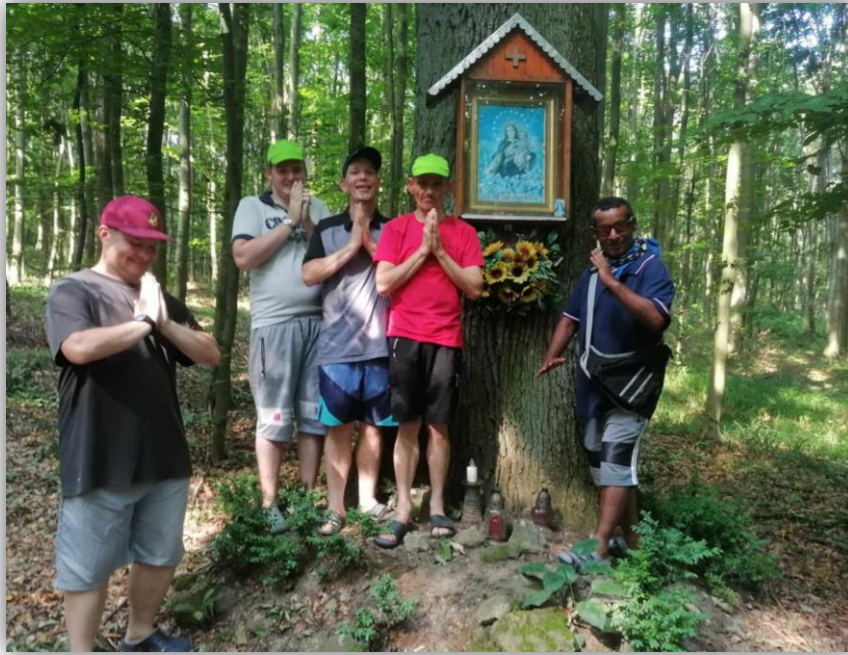
STANOVAČKA V BOJKOVEJ