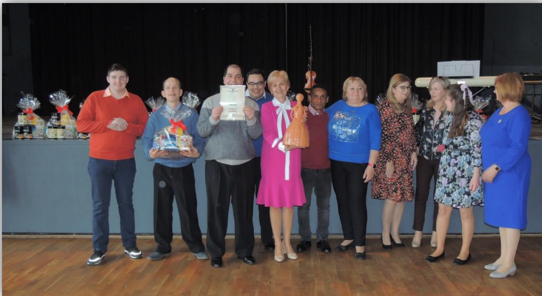
17. ROČNÍK ŠTRKOVECKEJ BARÓNKY – VÍŤAZ DSS ŠOPORŇA-ŠTRKOVEC