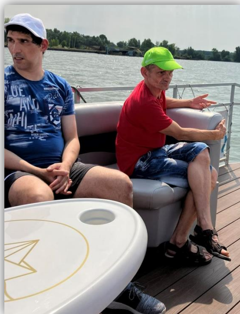
PLAVBA LOŽOU PO VÁHU