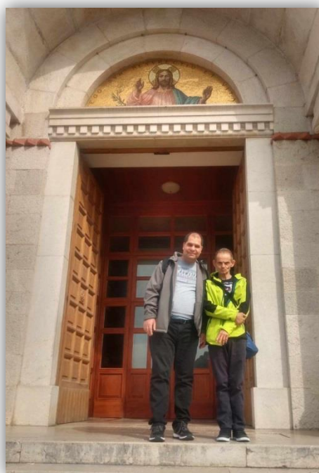
CESTY ZA VIEROU