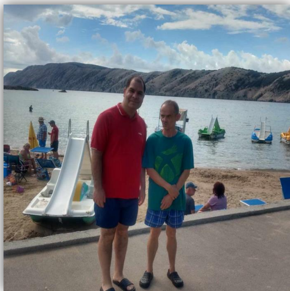
MORE V CHORVÁTSKU