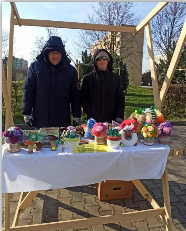
VELKONOČNÉ TRHY, VÚC TRNAVA