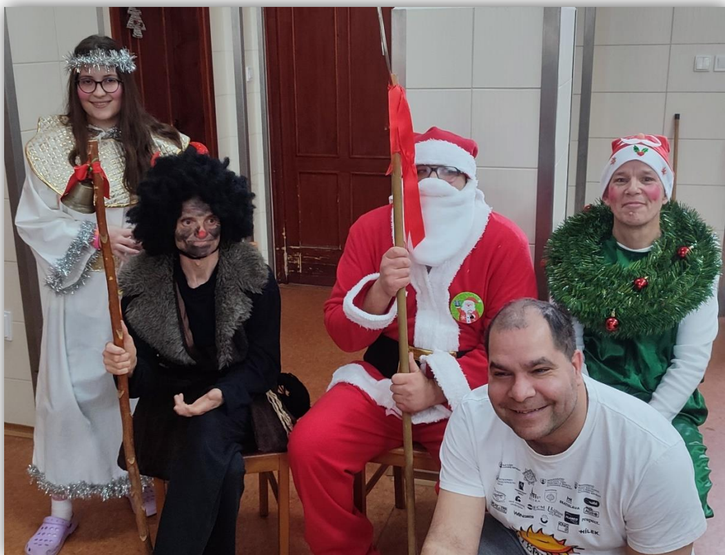
MIKULÁŠ A VIANOCE V DSS