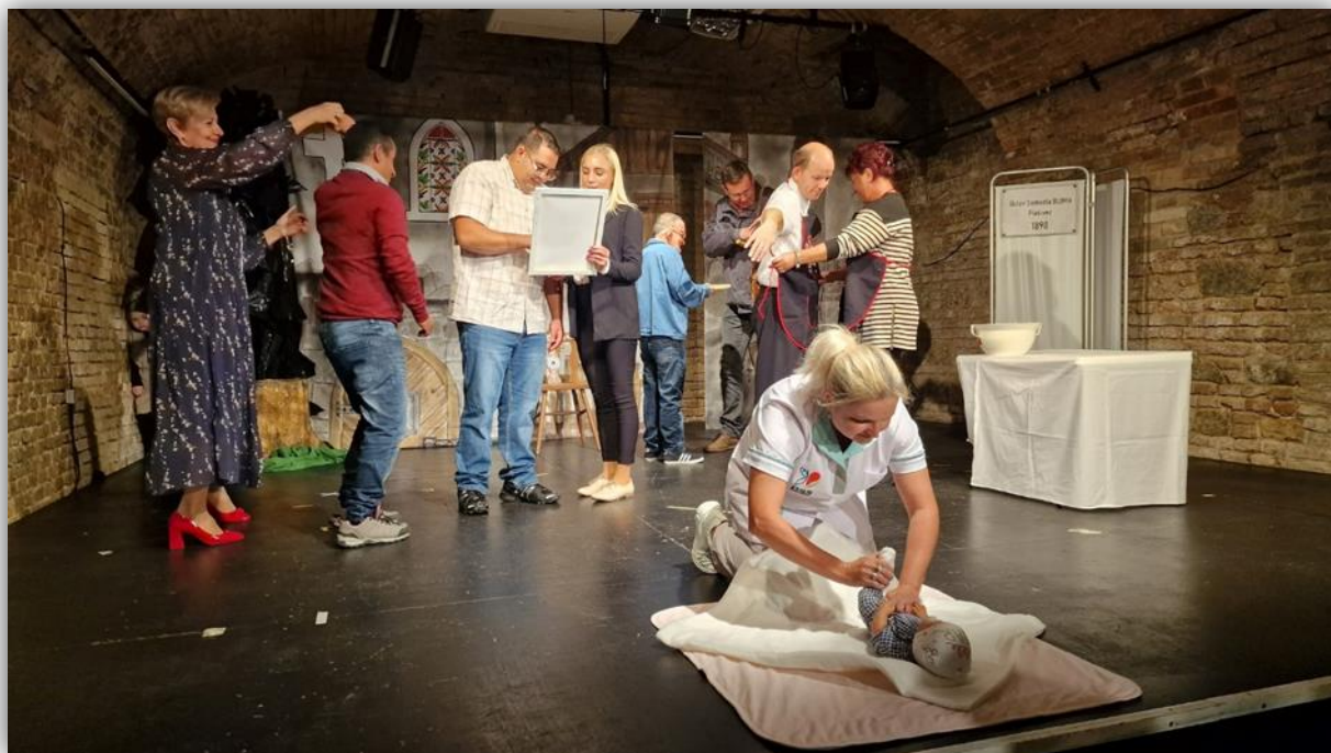
VYSTÚPENIE V DIVADLE ASTORKA V BRATISLAVE