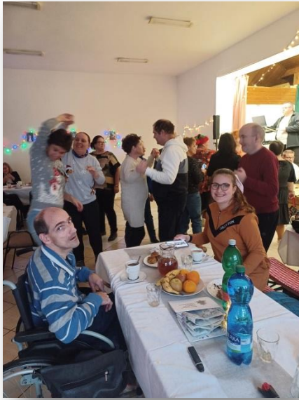
VIANOČNÝ VEČIEROK, ŠINTAVA