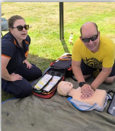
DOTKNI SA PRÍRODY, BOJKOVÁ