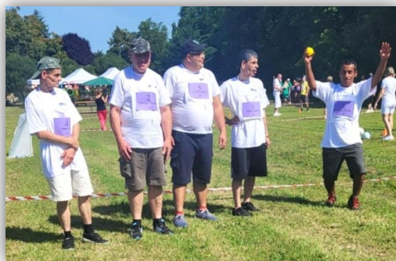
OLYMPIÁDA V KOŠÚTOCH