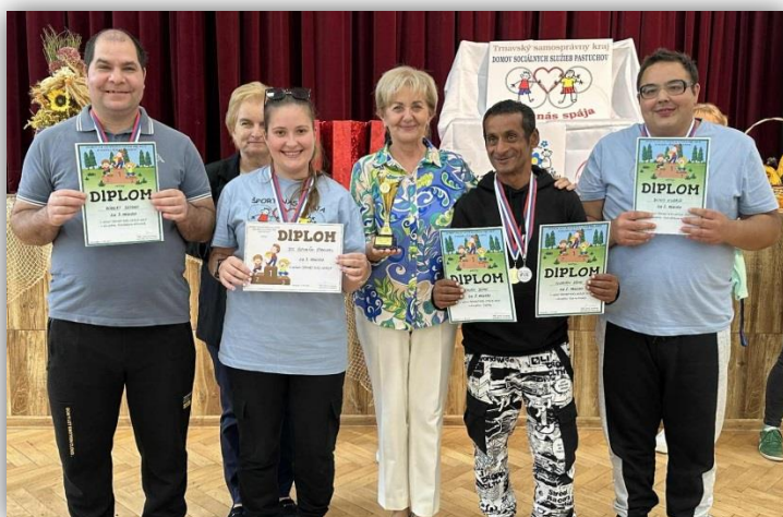
ŠPORT NÁS SPÁJA, PASTUCHOV