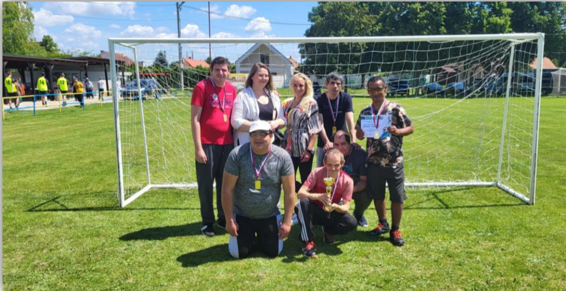
FUTBALOVÝ DEŇ V JAHODNEJ