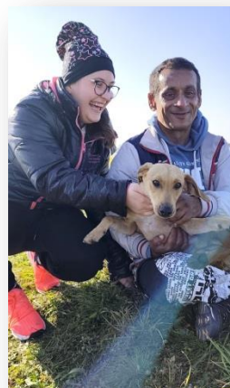
ZVIERATKÁ SÚ NAŠE LÁSKY