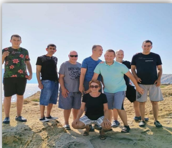
DOVOLENKA V CHORVÁTSKU