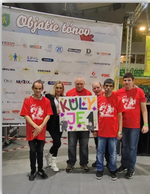
KONCERT V LEVICIACH