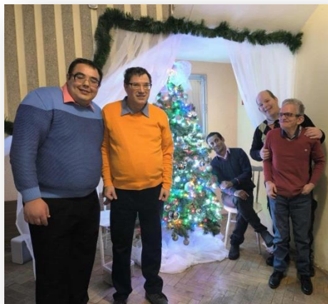
KATARÍNSKA ZÁBAVA, LEHNICE