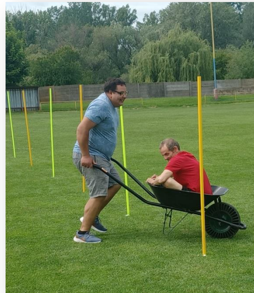
ŠPORTOVÝ DEŇ V ŠOPORNI