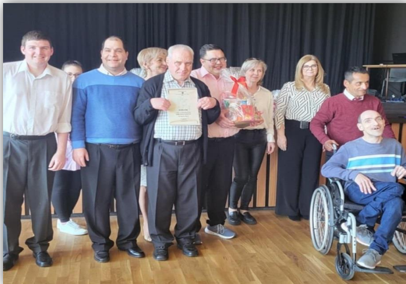
19.ROČNÍK ŠTRKOVECKEJ BARÓNKY