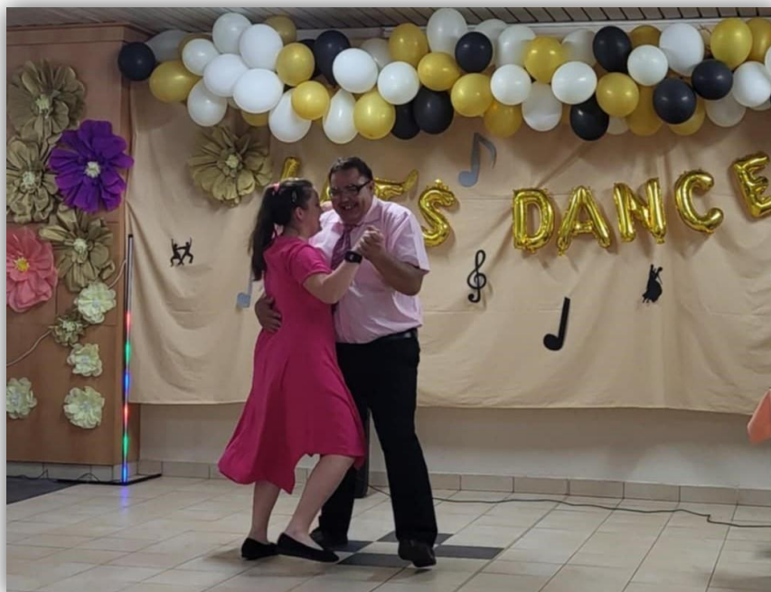
LET'S DANCE V SENICI