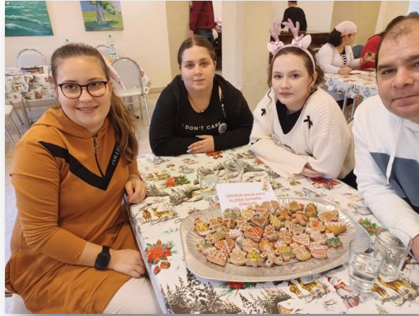
ZDOBENIE MEDOVNÍKOV, GALANTA