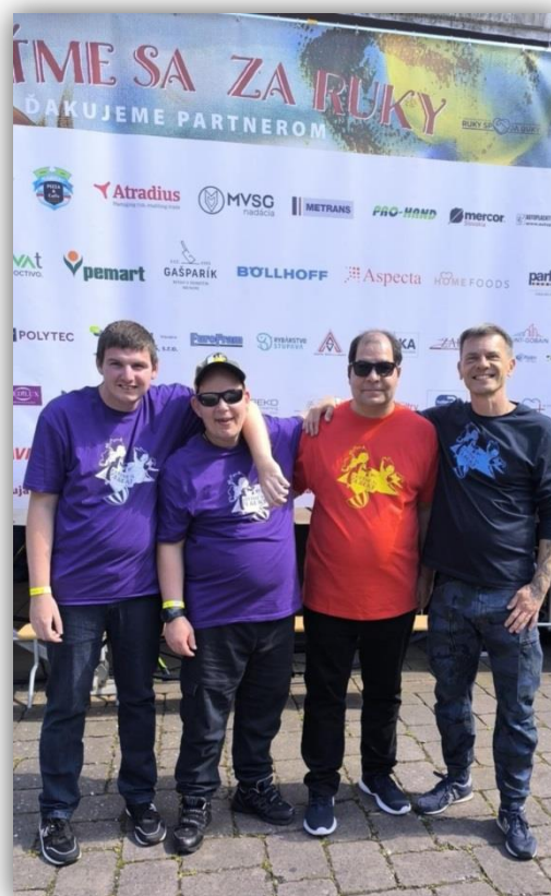
KONCERT V GALANTE