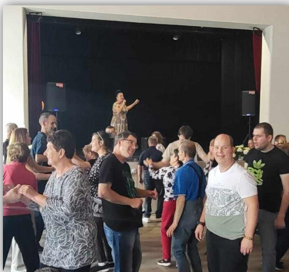
KONCERT V JAHODNEJ