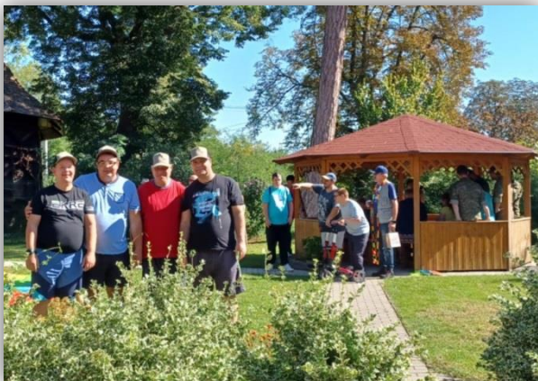
GULÁŠ PÁRTY, CSS