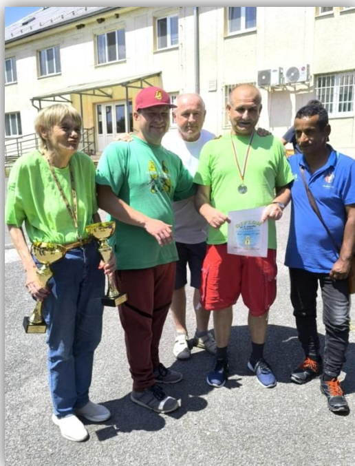
TURNAJ V STOLNOM TENISE, KOSTOLNÁ ZÁRIEČIE