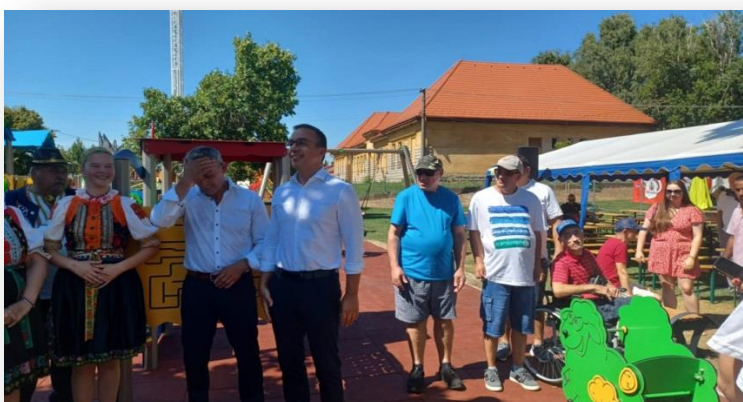
OTVORENIE IHRISKA, ŠOPORŇA