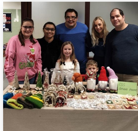
VIANOČNÉ TRHY V ZŠ s MŠ ŠOPORŇA